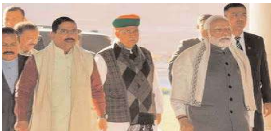
న్యూఢిల్లీ, అక్షిత ప్రతినిధి :

పార్లమెంట్ లో భద్రతా వైఫల్యంపై కేంద్ర ప్రభుత్వం ప్రకటన చేయాలంటూ ప్రతిపక్షాలు ఆం దోళన చేస్తుండటంపై ప్రధాని నరేంద్రమోదీ తీవ్ర వ్యాఖ్యలు చేశారు. ఇటీవల జరిగిన ఐదు రాష్ట్రాల అసెంబ్లీ ఎన్నికల్లో ఓటమితో ప్రతిపక్షాలు నిరాశ, నిస్సహాయ లకు లోనయ్యాయని ఆయన ఎద్దేవా చేశారు. ఆ ప్రస్టేషన్ తోనే ప్రతిపక్ష పార్టీల సభ్యులు పార్లమెంట్ ఉభయసభల్లో గండరగోళ పరిస్థితులు సృష్టించారని విమర్శించారు. ఢిల్లీలో మంగళవారం జరిగిన బీజేపీ పార్లమెంటరీ పార్టీ భేటీలో ప్రధాని మోదీ ఈ వ్యాఖ్యలు చేశారు. ప్రతిపక్ష పార్టీల ఈ తరహా ప్రవర్తన చూస్తుంటే రానున్న