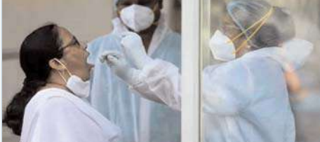
న్యూఢిల్లీ, అక్షిత ప్రతినిధి :

దేశంలో మళ్లీ కరోనా కేసులు కలకలం సృష్టించాయి. కొత్తగా 142 కేసులు నమోదైనట్లు కేంద్ర ఆరోగ్య మంత్రిత్వ శాఖ వెల్లడించింది. దీంతో యాక్టివ్ కేసుల సంఖ్య 1,970కి చేరింది. కర్ణాటకలో ఒకరు మృతి చెందారు. నిన్ను కేరళలో ఐదుగురు, యూపీలో ఒకరు ప్రాణాలు కోల్పోయిన సంగతి తెలిసింది. దీంతో కరోనా మృతుల సంఖ్య ఏడుగురు చేరింది. కరోనా కారణంగా ఇప్పటి వరకు 5,33,318 మంది మరణించినట్లు ఆరోగ్య మంత్రిత్వ శాఖ తెలిపింది. కరోనా నుంచి 4.44 కోట్ల మంది రికవరీ కాగా, రికవరీ రేటు 98.81 శాతంగా ఉంది.