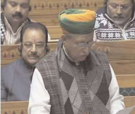
న్యూఢిల్లీ, అక్షిత ప్రతినిధి :

పార్లమెంట్ లో సస్పెన్షన్ల పరంపర కొనసాగుతోంది. ఇవాళ కూడా 49 మంది లోక్ సభ ఎంపీలను సస్పెండ్ చేశారు. స్పీకర్ అటాక్ పై కేంద్ర హోంశాఖ మంత్రి అమిత్ షా ప్రకటన చేయాలని విపక్ష సభ్యులు డిమాండ్ చేస్తున్న విషయం తెలిసింది. అయితే ఆందోళన చేస్తున్న సభ్యుల్ని రోజువారీగా సస్పెండ్ చేస్తోంది ప్రభుత్వం. సోమవారం ఒక్క రోజే పార్లమెంట్ లో 79 మంది ఎంపీలను సస్పెండ్ చేశారు. అదే జోరులో ఇవాళ కూడా మరో 49 మంది ఎంపీలను సస్పెండ్ చేశారు. దీంతో పార్లమెంట్ నుంచి శీతాకాల సమావేశాల్లో సస్పెన్షన్ కు గురైన వారి సంఖ్య మొత్తం 141కి చేరుకున్నది.