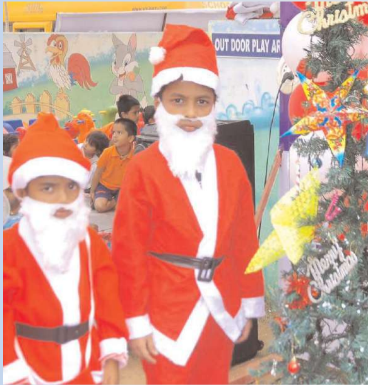
ఖమ్మం/అక్షిత బ్యూరో :

ఖమ్మం నగరం స్మార్ట్ కిడ్స్ పాఠశాలలో శనివారం సెమీ క్రీస్మస్ సంబురాలు నిర్వహించారు. పాఠశాలలో ఏర్పాటుచేసిన ఏనుక్రీస్తు జన్మ వృత్తాంతాన్ని తెలియజేసే సన్నివేశాలు అందరినీ