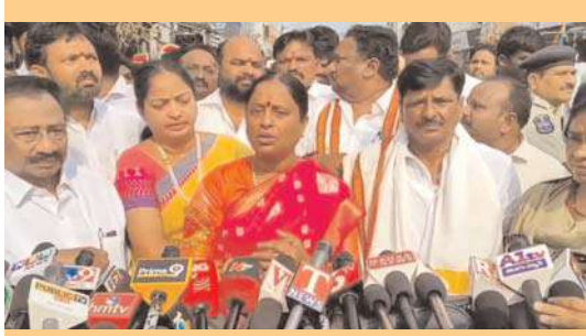
వరంగల్, అక్షిత బ్యూరో:

వైకుంఠ ఏకాదశి సందర్భంగా వరంగల్ నగరంలోని బట్టల బజార్ వెంకటేశ్వర స్వామి ఆలయంలో ప్రత్యేక పూజలు చేసిన