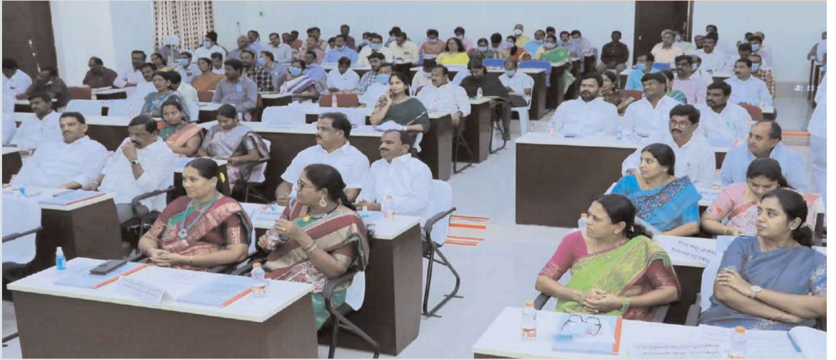
పౌరసరఫరాలు, వ్యవసాయ శాఖ, మార్కెటింగ్ శాఖలపై సమీక్షిస్తూ