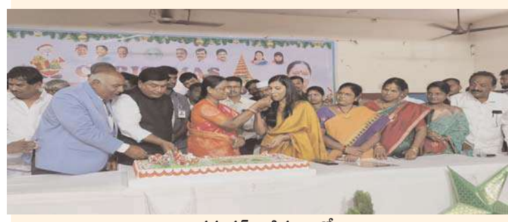
వరంగల్, అక్షిత బ్యూరో: