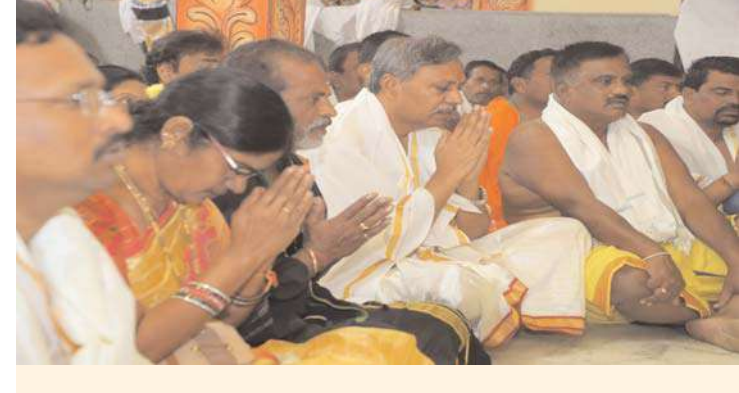
జనగామ, అక్షిత ప్రతినిధి: