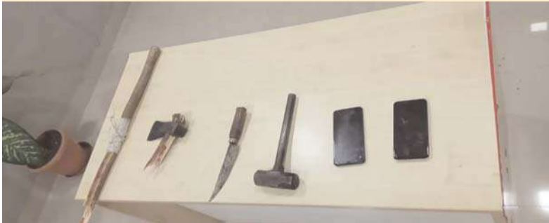
అదిలాబాద్/ అక్షిత బ్యూరో

అదిలాబాద్ జిల్లా ఇచ్చోడ మండల కేంద్రం లో నిన్న జరిగిన యువకుని దారుణ హత్యకు ఆస్తి తగాదాలే ప్రధాన కారణమని, మృతుడు, మృతుని తండ్రి, హత్య చేసిన వ్యక్తులు సంబంధితులనని... తమకు రావాల్సిన భూమిని... మృతుడు పెన్షన్ పథకం దరఖాస్తు ఫారం అని తమ తల్లి సంతకం తీసుకున్నాడని తన పేరు పై చేసుకున్నాడని, కుల పెద్దల సమక్షంలో కూడా 2, 3, సార్లు పంచాయతీ పెట్టడం, హత్యకు పాల్పడిన వారు చేసుకోవేసిన షేడ్ మృతుడు, మృతుని తండ్రి కూల్చివేసిన నుండి.. వీరిని హత్య చేయాలని పగ పెంచుకుని నిన్న (మంగళ వారం) ఉదయం