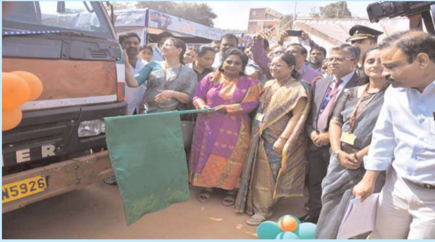
ప్రయత్నాలు ఉంటాయని అన్నారు. ఈ సందర్భంగా గవర్నర్ మాట్లాడుతూ.. సోదరి మణులు కష్ట పడకుండా ఉండాలని పిఎం ఉజ్వల...మిగతా 2లో

వికసిత భారత్ సంకల్ప యాత్ర నేడు తెలంగాణలో వివిధ జిల్లాల్లోని పట్టణ ప్రాంతాల్లో ఈ రోజు ప్రారంభమైంది. తెలంగాణ గవర్నర్ డాక్టర్ తమిళిసై సౌందర రాజన్ హైదరాబాద్లోని లాలాపేట్ మున్సిపల్ గ్రౌండ్స్ లో కేంద్ర ప్రభుత్వ పథకాలకు సంబంధించిన సమగ్ర సమాచారం అందించే వీడియో వ్యాన్ ను జెండా ఊపి లాంఛనంగా ప్రారంభించారు. ఈ సందర్భంగా ప్రధాన మంత్రి నరేంద్ర మోదీ దేశ వ్యాప్తంగా ఉన్న లబ్ధిదారులతో వర్చువల్ గా మాట్లాడారు. లబ్ధిదారులు అందుకుంటున్న అభివృద్ధి ఫలాల పట్ల ఆనందం వ్యక్తం చేశారు. వికసిత భారత్ సంకల్ప యాత్ర ద్వారా ఇప్పటి వరకు చేరుకొని లబ్ధిదారులను చేరుకొంటున్నందుకు సంతోషం వ్యక్తం చేశారు. కేంద్ర ప్రభుత్వ పథకాలు చివరి లబ్ధి దారుడికి చేరే వరకు తమ