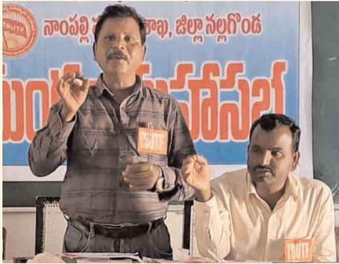
నాంపల్లి, అక్షత న్యూస్: