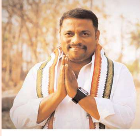
సిద్దిపేట డిసెంబర్ 27 అక్షిత స్పూస్.