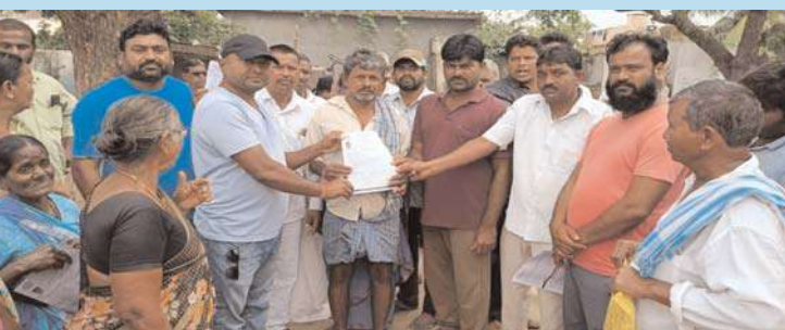
వేడుకలపల్లి, అక్షయ ప్రతినిధి :

జాతీయ కాంగ్రెస్ పార్టీ 139వ ఆవిర్భావ దినోత్సవం