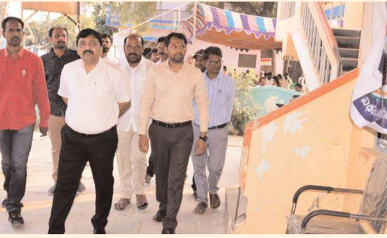
జనగామ, అక్షయ ప్రతినిధి: