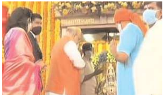
మంచి ఫలితాలు సాధించాలి భాగ్యలక్ష్మి ఆలయంలో పూజలు

కొత్త ప్రభుత్వం పాలన, రాజకీయ పరిణామాలపై నేతలతో చర్చ ఎన్నికల ఫలితాలపై బీజేపీ నేతలకు దిశానిర్దేశం వ్యక్తిగత లక్ష్యాల కోసం కాకుండా పార్టీ కోసం పనిచేయాలి ముఖ్యనేతల మధ్య కోల్డ్ వార్ పై అమిత్ షా సీరియస్ నేతల మధ్య సమన్వయ లోపం లేకుండా చూడాలి పార్లమెంట్ ఎన్నికల్లో మరింత