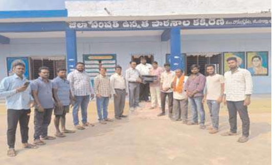
మనబడి ని మనమే బాగు చేసుకుందాం..