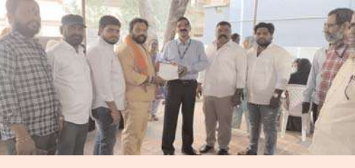
శేరిలింగంపల్లి అక్షయ ప్రతినిధి..