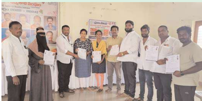
సిద్దిపేట డిసెంబర్ 28 అక్షిణి సమస్య.