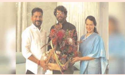
హైదరాబాద్, అక్షిత ప్రతినిధి :

ముఖ్యమంత్రి రేవంత్ రెడ్డిని టాలీవుడ్ సినీ హీరో అక్కినేని నాగార్జున, అమల దంపతులు మర్యాదపూర్వకంగా కలిశారు. శనివారం ఉదయం జూబ్లీహిల్స్ లోని సీఎం సినీసారిని కేరుకున్న నాగార్జున దంపతులు రేవంత్ కు పుష్పగుచ్ఛం ఇచ్చి తెలంగాణ ముఖ్యమంత్రిగా బాధ్యతలు చేపట్టిన సందర్భంగా ఆయనకు శుభాకాంక్షలు తెలిపారు. ప్రస్తుతం ఇందుకు సంబంధించిన వీడియోలు సామాజిక మాధ్యమాలలో వైరల్ అవుతున్నాయి.