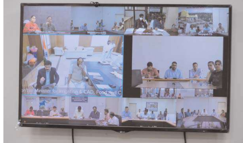
జనగామ, అక్షయ ప్రతినంది: