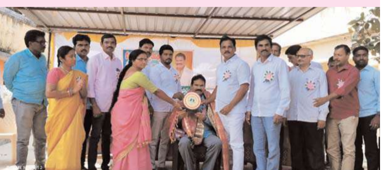
నాంపల్లి, అక్షత న్యూస్: