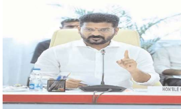
హైదరాబాద్, అక్షిత ప్రతినిధి :

ప్రజా పాలన దరఖాస్తుల అమ్మకాలపై ముఖ్యమంత్రి రేవంత్ రెడ్డి ఆగ్రహం వ్యక్తం చేశారు. దరఖాస్తుదారులకు అవసరమైనన్ని దరఖాస్తులను అందుబాటులో ఉంచాల్సిందేనని అధికారులను ఆదేశించారు. రైతుబంధు, పింఛన్లపై అపోహలకు గురి కావద్దని, పాత లబ్ధిదారులందరికీ యథావిధిగా ఈ పథకాలు అందుతాయని స్పష్టం చేశారు. గతంలో లబ్ధి పొందని వారు, కొత్తగా లబ్ధి పొందాలనుకునేవారు దరఖాస్తు చేసుకోవాలని సీఎం అన్నారు. ఈ విషయంలో ప్రజలు ఎలాంటి