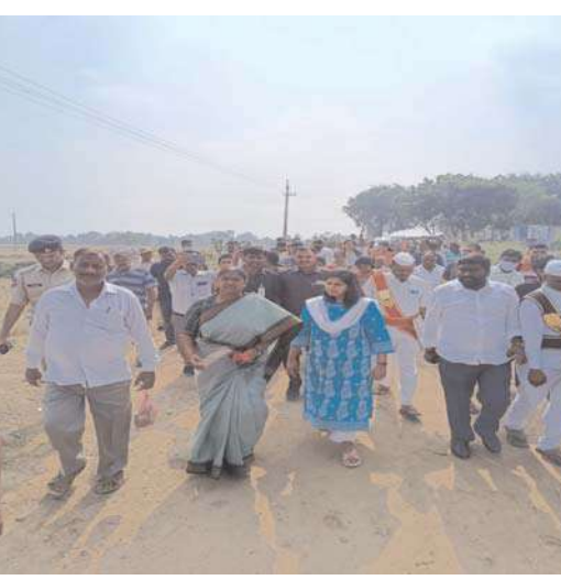
అన్నారు. శనివారం ప్రజా పాలన కార్యక్రమంలో భాగంగా

కొండపర్తి గ్రామానికి త్వరలోనే రోడ్ నిర్మాణం చేపట్టేలా చర్యలు తీసుకోవడం జరుగుతుందని పంచాయతీ రాజ్ మరియు స్త్రీ శిశు సంక్షేమ శాఖ మంత్రి దనసరి అనసూయ సీతక్క