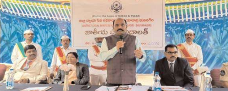
యాదాద్రి భువనగిరి అక్షయ ప్రతినిధి :