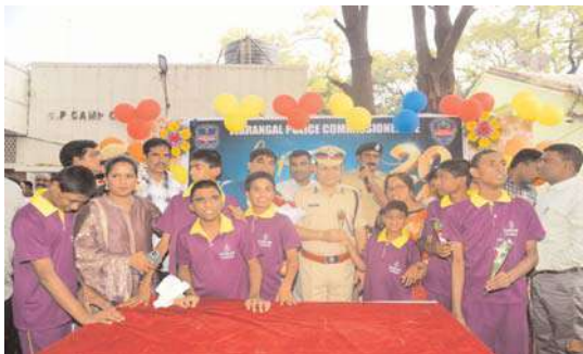
వరంగల్, అక్షిత బ్యూరో: