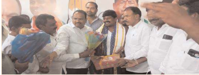
నకిరేకల్ అక్షిత ప్రతినిధి