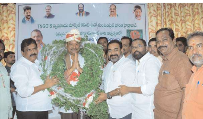
మిర్యాలగూడ, అక్షత ప్రతినిధి :