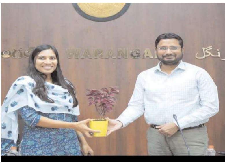
సంవత్సరం 2024 సందర్భం గా శుభాకాంక్షలు తెలియజేశారు.