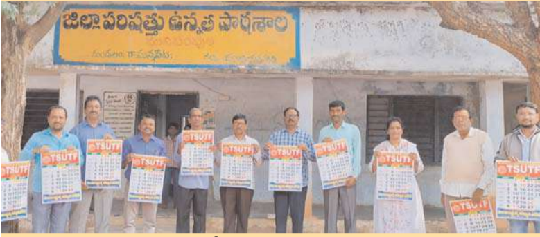
సకిరేకల్ అక్షత ప్రతినిధి