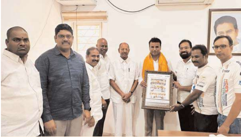
మేధుల్, అక్షత బ్యూరో: