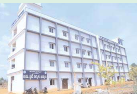
ఖమ్మం/అక్షిత బ్యూరో :

బిసి సంక్షేమ శాఖ బిసి స్టడీ సర్కిల్- ఖమ్మం ఆధ్వర్యంలో గ్రూప్ 1, 2, 3, 4 ఫౌండేషన్ కోర్సుకు ఉచిత శిక్షణకు దరఖాస్తుల ఆహ్వానం ఉమ్మడి ఖమ్మం జిల్లాలోని బిసి ఎస్సీ ఎస్టీ కుటుంబాల డిగ్రీ పాస్టలు ఆధ్వర్యం గ్రూప్ 1, 2, 3, 4 ఫౌండేషన్ కోర్సుకు ఉచిత శిక్షణకు దరఖాస్తులు చేసుకోవలెను అని జిల్లా కలెక్టర్ వి.వి. గౌతమ్ ఒక ప్రకటనలో తెలియజేశారు. అర్హులైన అభ్యర్థులు ఈనెల 8 నుంచి 20 తేదీ వరకు ఆన్లైన్ దరఖాస్తును ఈ క్రింది వెబ్సైట్ ద్వారా అప్లై చేసుకోవాలని తెలిపారు. ఈ ఉచిత శిక్షణ ఫిబ్రవరి 1 నుండి ప్రారంభం అవుతుందని ఈ శిక్షణ నాలుగు నెలలు ఉండునని ఆధ్వర్యాలకు ఆదాయ ప్రవీకరణ పత్రం రూ.5 లక్షల లోపు ఉండాలన్నారు. అభ్యర్థుల ఎంపిక విధానం రిజిస్ట్రేషన్ మరియు డిగ్రీ పరీక్షలో వచ్చిన మార్కుల ఆధారంగా ఉంటుంది. అమలులో ఉన్న నిబంధనల ప్రకారం స్టడీ మెటీరియల్ అందిస్తారు. ఇతర వివరాలకు 08742-227427, 9573859598, 9441931359 సంబద్ధ ను సంప్రదించాలని సూచించారు.