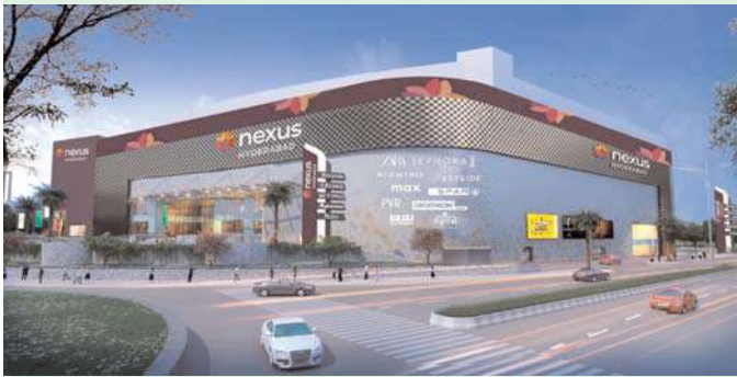
శేరిలింగంపల్లి అక్షిత ప్రతినిధి:

శీతాకాలానికి ముగింపు పలుకుతూ, మకర సంక్రాంతి వచ్చేసింది - ఎక్కువ రోజులు మరియు కొత్త వ్యవసాయ సీజన్ ప్రారంభం. పండుగ సీజన్ పొల్లినదాన్ని ప్రోత్సహిస్తుంది. ఈ పండుగ యొక్క అత్యంత ప్రతిష్టాత్మకమైన సంప్రదాయాలలో. ఈ సంప్రదాయాలను ఉత్సాహభరితమైన రంగులతో సుసంపన్నం చేసేందుకు, నెక్సస్ హైదరాబాద్ మార్ట్ రంగోలి పోటీని నిర్వహిస్తోంది మరియు పిల్లలకు గాలిపటాలు పంపిణీ చేస్తోందిని నిర్వాహకులు తెలిపారు. రంగోలి, ఒక శక్తివంతమైన మరియు కళాత్మక వ్యక్తికరణ, శ్రేయస్సును సూచిస్తుంది, అయితే పతంగాలను ఎగురవేయడం పురాతన సంప్రదాయం ఉత్సాహాలకు ఆనందాన్ని ఇస్తుంది. రంగోలి పోటీ పోషకులకు వారి సృజనాత్మకతను ప్రదర్శించడానికి ఒక వేదికను అందిస్తుంది మరియు వేడుకలో కుటుంబ భాగస్వామ్యాన్ని ప్రోత్సహిస్తూ పిల్లలకు కాంప్లిమెంటరీ గాలిపటాలు పంపిణీ చేయబడతాయన్నారు. ఈ శుభ సందర్భంలో, నెక్సస్ హైదరాబాద్ మార్ట్, జనవరి 1 నుండి జనవరి 28 వరకు జరిగే ముగింపు సీజన్ సేల్ సందర్భంగా పండుగ షాపింగ్లో పాల్గొనడానికి పోషకులందరికీ ప్రత్యేక ఆహ్వానాన్ని అందిస్తోంది. అదనంగా, జనవరి 5, 6 మరియు 7వ తేదీలలో అద్భుతమైన షాట్ 50% తగ్గింపు డీల్లు, జనవరి 2 నుండి 14 జనవరి వరకు సంక్రాంతి సేల్తో పాటు, 50% వరకు తగ్గింపులను అందిస్తూ, పండుగ షాపింగ్కు మిస్సవలెని అవకాశాన్ని అందిస్తోంది. ఈ సంక్రాంతి, నెక్సస్ హైదరాబాద్ మార్ట్లో మీ ప్రియమైన వారితో గొప్ప సంస్కృతి మరియు సంప్రదాయంలో మునిగిపోయి, పండుగ కోసం షాపింగ్ చేసే అవకాశాన్ని పొందండి. సంతోషకరమైన కార్యక్రమాలు, ఉత్సాహభరితమైన అలంకరణలు మరియు ఆనందాన్ని పాపింగ్ అనుభవంతో మకర సంక్రాంతి స్ఫూర్తిని స్వీకరించండి తెలిపారు.