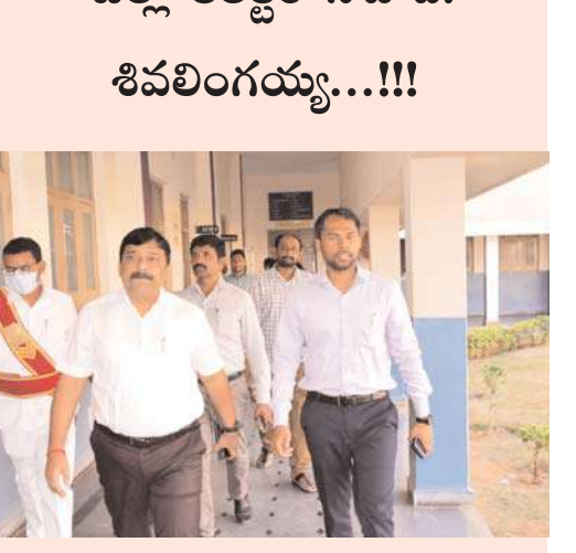
జనగామ, అక్షిత ప్రతినిధి: