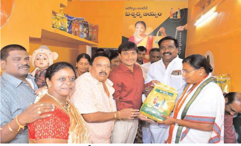
కోదాడ అక్షత ప్రతినిధి