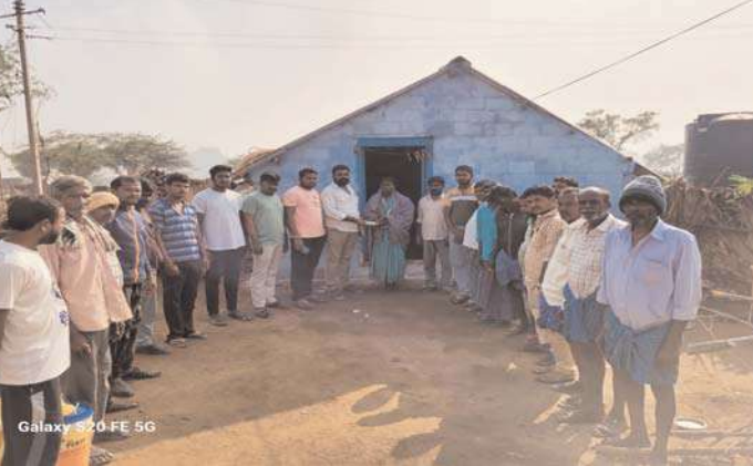
సకిరేకల్ అక్షిత ప్రతినిధి