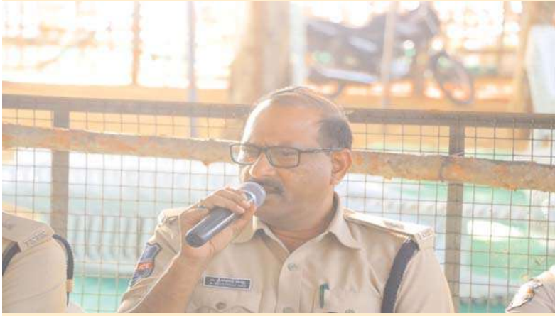
చేర్యాల, జనవరి 6 అక్షత ప్రతినీధి: