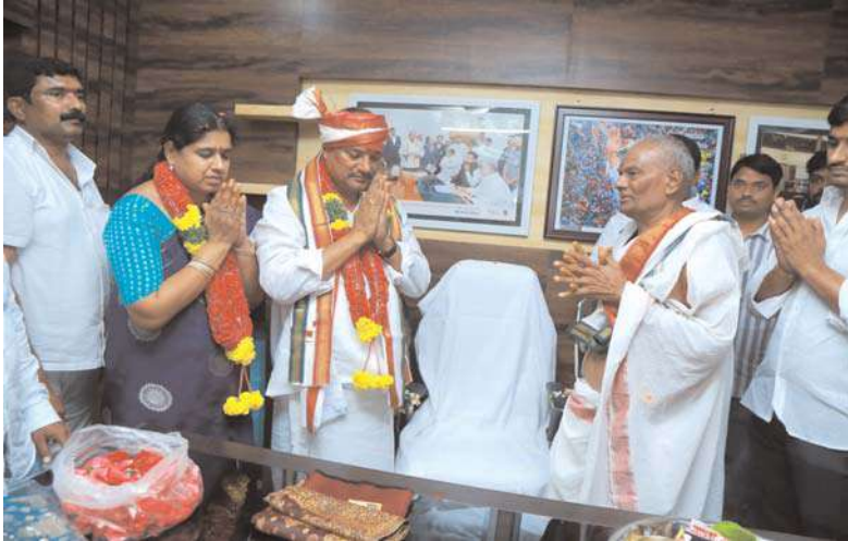
మిర్యాలగూడ, అక్షయ ప్రతినిధి :

అట్టహాసంగా మిర్యాలగూడ నియోజకవర్గంలోని కాంగ్రెస్ పార్టీ నాయకులు, శ్రేణులు, బిఎల్ ఆర్ బ్రదర్స్ అభిమానులతో కలిసి ఉత్సాహంగా, అట్టహాసంగా శనివారం మిర్యాలగూడ ఎమ్మెల్యే బతుల లక్ష్మారెడ్డి బిఎల్ఆర్ ఎమ్మెల్యే క్యాంపు కార్యాలయం ప్రజాభవన్ లోనికి ప్రవేశించారు. డిజై సౌంద్య నడుమ కార్యక్రమ అభిమానులు కాంగ్రెస్ పార్టీ జెండాలు చేతబాని ఆటపాటలతో ఉత్సాహంగా ఎమ్మెల్యే బిఎల్ఆర్ కు క్యాంప్ కార్యాలయం వద్ద స్వాగతం పలికారు. తొలుత ఎమ్మెల్యే బిఎల్ఆర్ అమరవీరుల స్తూపం వద్ద తెలంగాణ అమరవీరులకు నివాళులర్పించిన అనంతరం క్యాంప్ కార్యాలయం ప్రజా భవన్ లోకి ప్రవేశించారు. క్యాంప్ కార్యాలయంలో ప్రత్యేక పూజలు నిర్వహించారు. అనంతరం అన్ని మతాలవారు సర్వమత ప్రార్థనలు చేశారు. మిర్యాలగూడ నియోజకవర్గం ప్రజలకు నిరంతరం అందుబాటులో ఉండి అభివృద్ధి లక్ష్యంగా పనిచేస్తానని బిఎల్ఆర్ పేర్కొన్నారు. అఖండ మెజార్మెంట్ గెలిపించిన ప్రతి ఒక్కరికి కృతజ్ఞతలు తెలిపారు. వందలాదిమంది ఎమ్మెల్యే బిఎల్ఆర్ ను సన్మానించారు. మిర్యాలగూడ ఆర్డీఓ బి.చెన్నయ్య, డిఎస్పి వెంకటగిరి, సీఐలు రాఘవేందర్, నర్సింహారావు, సత్యనారాయణ, ఎస్ఐలు వివిధ శాఖల అధికారులు బిఎల్ఆర్ కు బోకేలు అందజేశారు. కార్యక్రమంలో నల్గొండ డిసిసి అధ్యక్షులు కే.శంకర్ నాయక్, టిపిసిసి మాజీ కార్యదర్శి డి. సై లాల్ నాయక్, మాజీ సభ్యులు రామలింగయ్య యాదవ్, రాష్ట్ర కాంగ్రెస్ నాయకులు, దామరచర్ల ఎంపీపీ నందిని రవితేజ, పట్టణ కాంగ్రెస్ అధ్యక్షులు గాయం ఉపేంద్రరెడ్డి, నూకల వేణుగోపాల్రెడ్డి, కిసాన్ సెల్ కాంగ్రెస్ జిల్లా