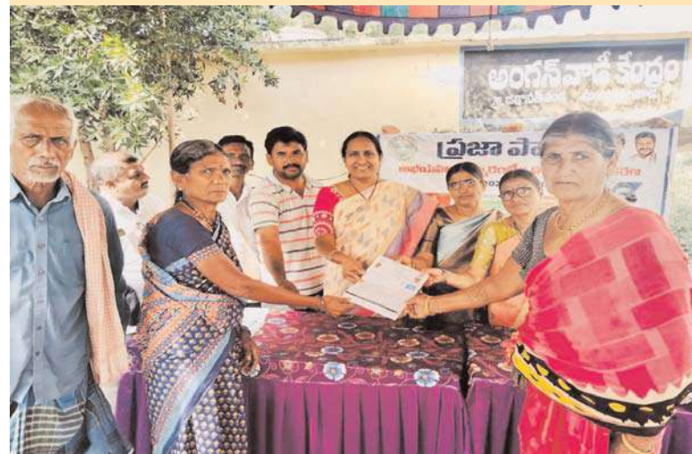
మిర్యాలగూడ, అక్షయ ప్రతినిధి :