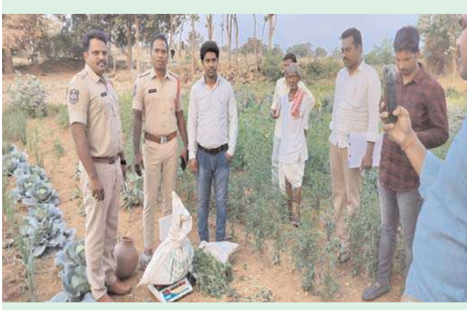
కొడంగల్, అక్షత ప్రతినధి :