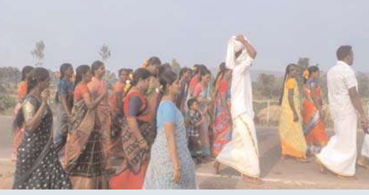
వాజేడు అక్షత స్మార్స్

వాజేడు మండలం పాయబల్ల గ్రామం లో చీకుపల్లి రామాలయం నుండి అయోధ్య రామయ్య అక్షింతలకు గ్రామస్తులు శ్రీరామ జయ రామ జయ జయ రామ అంటూ ఘన స్వాగతం పలికారు, పాయబల్ల గ్రామంలో గడపగడపకు ఊరేగింపుగా పంపిణీ కార్యక్రమం చేపట్టారు పంపిణీ కార్యక్రమంలో మేళ తాళాలతో శ్రీరామ జయరామ జయ జయ రామ అంటూ నినాదాలతో గ్రామమంతా మార్చోగింది, అయోధ్య రామయ్య ఓపింగింగ్ రోజు రాముని దర్శనం కోసం అందరూ రావాలని రామ భక్తులు కోరుతున్నారు. ఈ కార్యక్రమంలో గ్రామంలోని పెద్దలు యువకులు పిల్లలు పెద్ద ఎత్తున పాల్గొని శ్రీరామ నామం జపించారు.