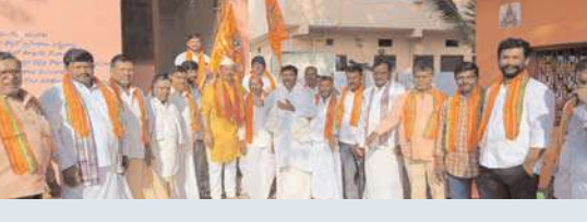
కూకట్ పల్లి, అక్షత ప్రతినధి: