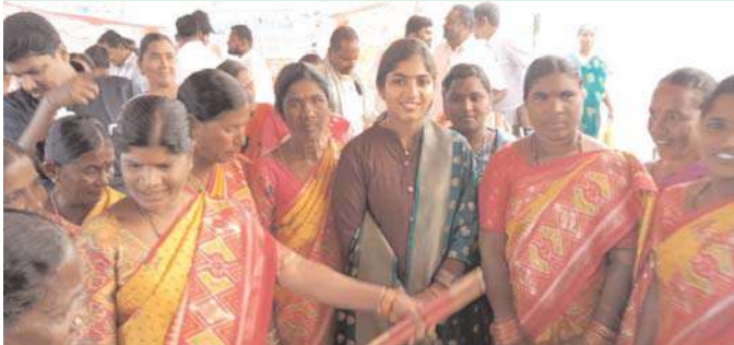
జనగామ, అక్షత ప్రతినధి: