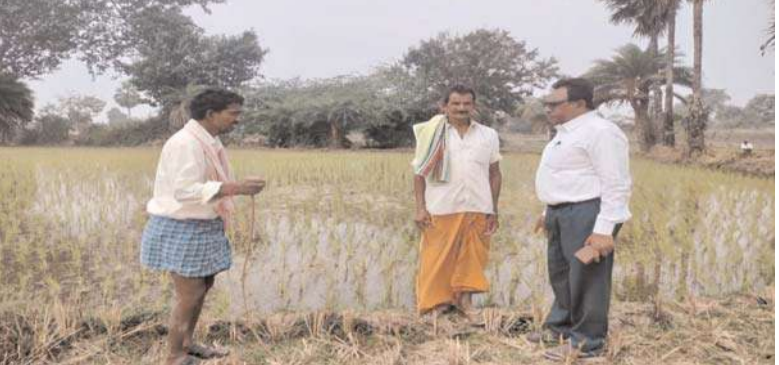
నాపల్లి, అక్షిత న్యూస్: