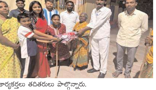
కార్యకర్తలు తదితరులు పాల్గొన్నారు.