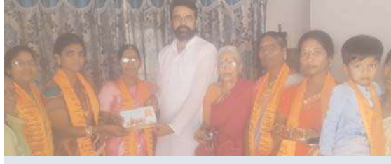
చేర్యాల, జనవరి 9 అక్షిత ప్రతినిధి: