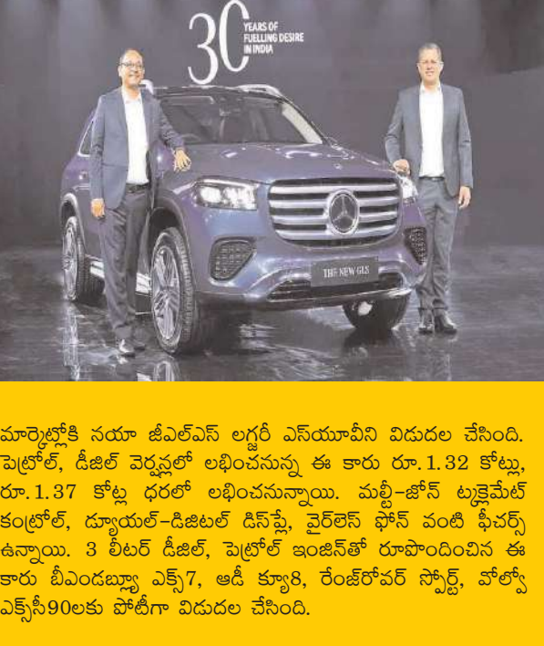
మార్కెట్లోకి నయా జీఎల్ఎస్ లగ్జరీ ఎస్ఎస్ఎస్ఎస్ విడుదల చేసింది. పెట్రోల్, డీజిల్ వెర్షన్లలో లభించనున్న ఈ కారు రూ. 1.32 కోట్లు, రూ. 1.37 కోట్ల ధరలో లభించనున్నాయి. మళ్లీ-జీఎస్ ట్యూమ్ వంటి కంట్రోల్, డ్యూయల్-డిజిటల్ డిస్ప్లే, వైర్లెస్ ఫోన్ వంటి ఫీచర్స్ ఉన్నాయి. 3 లీటర్ డీజిల్, పెట్రోల్ ఇంజన్లతో రూపొందించిన ఈ కారు బీదంబర్లు ఎక్స్ 7, ఆడి క్యూ8, రేంజ్ రోవర్ స్పోర్ట్, వోల్వో ఎక్స్ 90లకు పోటీగా విడుదల చేసింది.