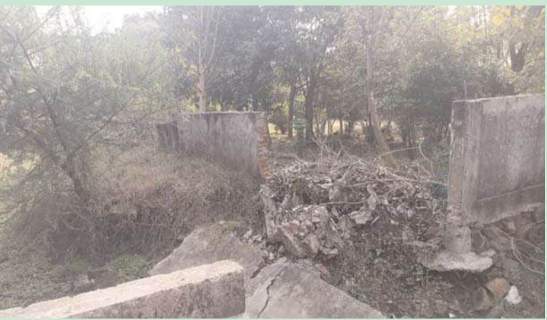
అదిలాబాద్ అక్షిణి బ్యూరో:-

పేరుకే బోధ్ నియోజక వర్గ కేంద్రం. ప్రకృతి సంరక్షణ లో ఏర్పాటైనా పల్లె ప్రకృతి వనాలు నిరాధారణ కు లోనై కొన్ని చోట్ల అసాంఘిక కార్యాక్రమాలకు అడ్డాలుగా మారాయి. బోధ్ లోని పల్లె ప్రకృతి వనానికి వెళ్లే దారి లో ఆదర్శ పాఠశాల, కస్తూర్బా స్కూల్ ఖల్ల ఉన్నాయి. వాటి ప్రహారీ గోడలు కూలిపోయినవి. పల్లె ప్రకృతి వనానికి వెళ్లే దారిలో వర్షపు నీటి ప్రవాహం కు రోడ్డు రెండు చోట్ల కోతకు గురై మోకాలి మంటి లొందలు ఏర్పడ్డాయి. వనానికి వెళ్లే