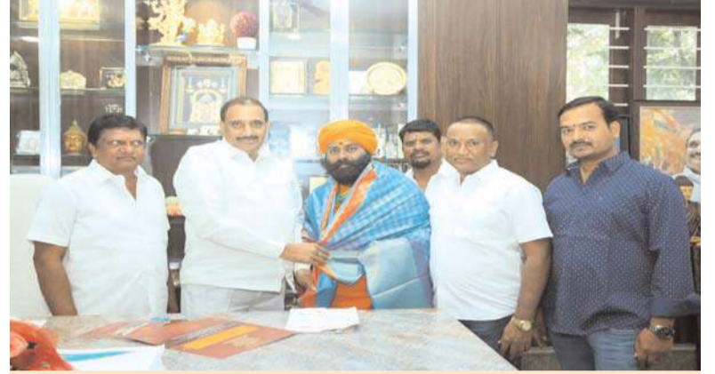
శేరిలింగంపల్లి అక్షిత ప్రతినిధి