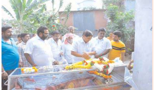
వేములపల్లి, అక్షిణి ప్రతినది :