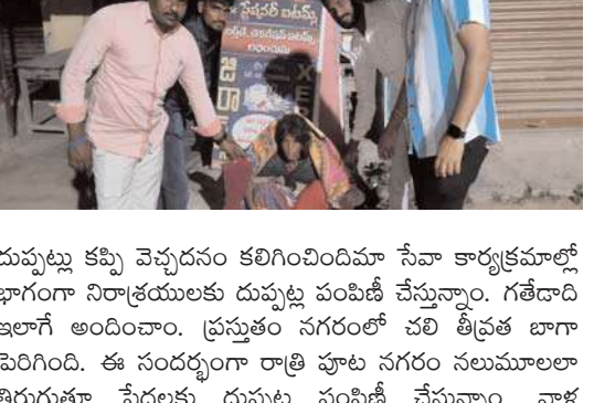
దుప్పట్లు కప్పి వెచ్చదనం కలిగించిందా సేవా కార్యక్రమాల్లో భాగంగా నిరాశ్రయులకు దుప్పట్లు పంపిణీ చేస్తున్నాం. గతేడాది ఇలాగే అందించాం. ప్రస్తుతం నగరంలో చలి తీవ్రత బాగా పెరిగింది. ఈ సందర్భంగా రాత్రి పూట నగరం నలుమూలలా తిరుగుతూ పేదలకు దుప్పట్లు పంపిణీ చేస్తున్నాం. వాళ్ల ముఖాల్లోని ఆనందం వెలలేనిదిగా మనం సైతం భావిస్తోంది అన్నారు.