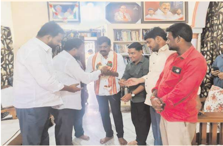
- ఈ నెల 14న శ్రీ గోదాదేవి కళ్యాణోత్సవం - అందజేసిన ఆలయ కమిటీ చైర్మన్ నకిరేకల్ అక్షిత ప్రతినిధి