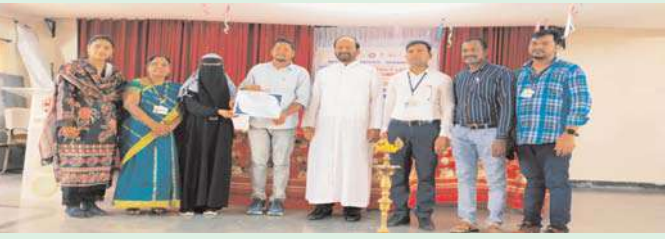
జనగామ, అక్షిత ప్రతినిధి: