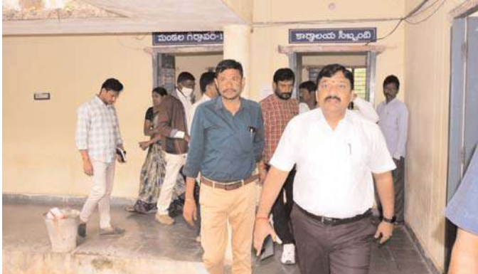
జనగామ, అక్షిత ప్రతినిధి: