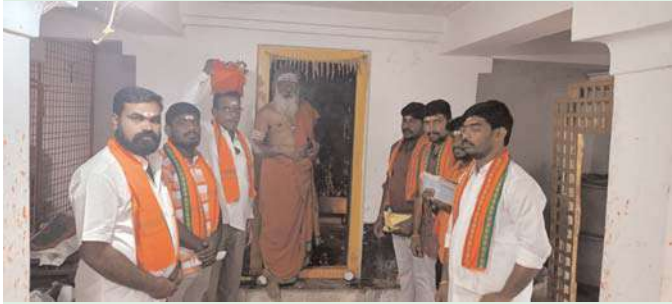
సకిరేకల్ అక్షిత ప్రతినిధి