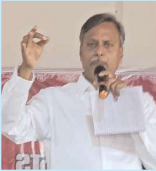
జనగామ, అక్షిత ప్రతినిధి: