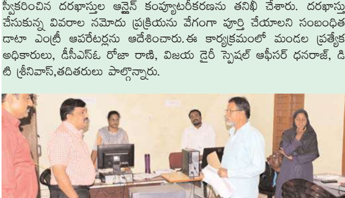
జనగామ, అక్షిత ప్రతినిధి: