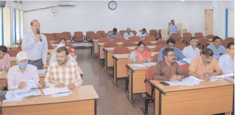
(మొదటి పేజీ తరువాయి)