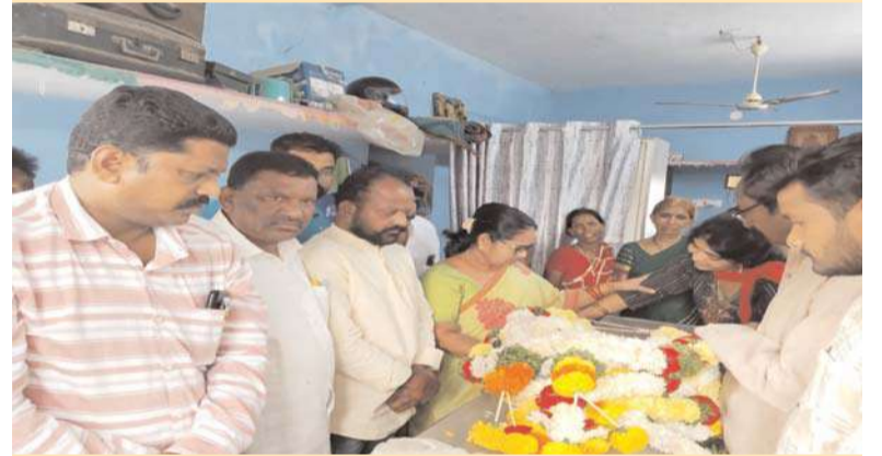
తుంగతుర్తి అక్షిత ప్రతినిధి.....