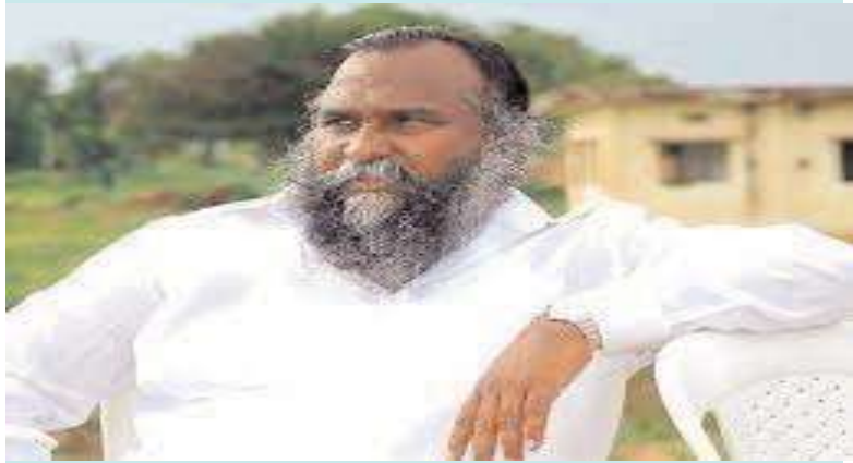
హైదరాబాద్, అక్షయ ప్రతినది: