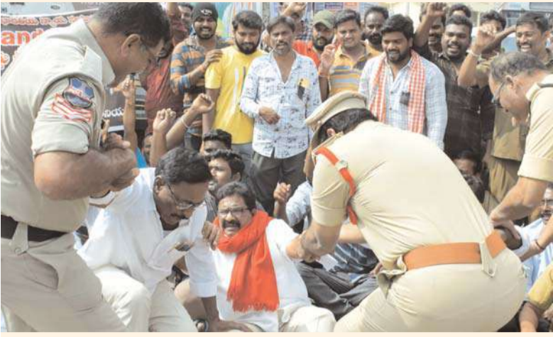
మిర్యాలగూడ, అక్షిత ప్రతినిధి :