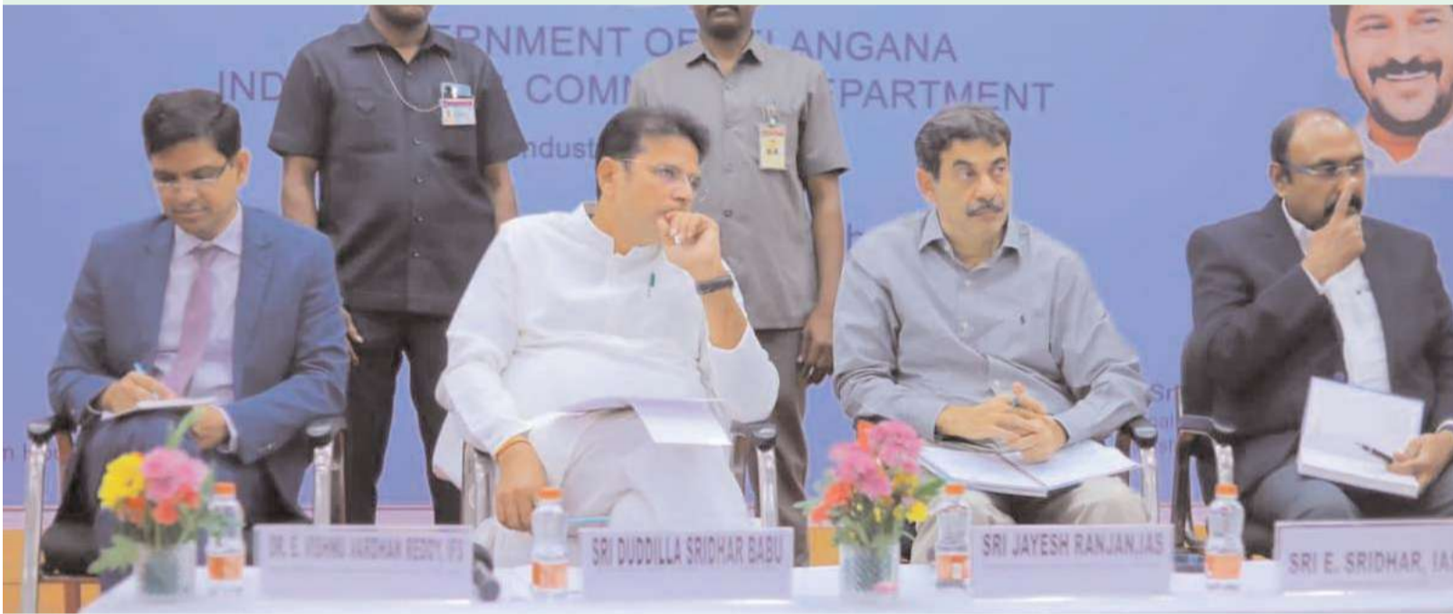
హైదరాబాద్, అక్షిత ప్రతినిధి :

విమర్శించారు. తమకు రాజకీయం చేయడం అలవాటు లేదని, రాష్ట్రాన్ని ఎలా బాగు చేయాలన్న ఆలోచన, తపనతో ప్రతి క్షణం పని చేస్తున్నామని స్పష్టం చేశారు. 1991 లో ఈ దేశం అప్పటి ప్రధాని పీవీ నరసింహా రావు నేతృత్వంలో కీలక మలుపు తిరిగిందని, పీవీ ప్రధానిగా, మన్మోహన్ సింగ్ ఆర్థిక మంత్రిగా విప్లవాత్మకమైన నిర్ణయాలు తీసుకోవడం ద్వారా వాళ్లు దేశాన్ని ముందుకు తీసుకువచ్చారని కొనియాడారు. పారిశ్రామికంగా హైదరాబాద్ ఈ ప్రపంచానికి కోవిడ్ వాక్సిన్ ఇచ్చేలా అభివృద్ధి చెందిందని, బయటి దేశాలు ముఖ్యంగా అభివృద్ధి చెందిన దేశాలు సైతం హైదరాబాద్ ను ఫార్మా ఇండస్ట్రీ హబ్ గా గుర్తిస్తున్నామని చెప్పారు. హైదరాబాద్ లో మిస్సైల్ తయారై .. ఇజ్రాయిల్ కి ఎగుమతి అవుతోందంటే పారిశ్రామిక రంగం ఎంత అభివృద్ధి చెందింది తెలిసిపోతుందని అభిప్రాయపడ్డారు. అదాని కంపెనీ వ్యవహారంలో కొంతమంది కావాలని కాంగ్రెస్ ని టార్గెట్ చేస్తున్నారని మండిపడ్డారు. అన్ని వర్గాల పారిశ్రామిక వేత్తలకు అవకాశం రావాలన్నది కాంగ్రెస్ పార్టీ ఉద్దేశమని, తమ నాయకుడు రాహుల్ గాంధీ అదానీని వ్యతిరేకించారు కానీ అభివృద్ధిని కాదని స్పష్టం చేశారు. ప్రస్తుతం రాష్ట్రంలో అదానీ పెట్టుబడులు ఉన్నాయని, వాళ్ళతో పాటు అనేక కంపెనీలు ఉన్నాయని, రాష్ట్ర అభివృద్ధిపైనే తమ ఆలోచన ఉంటుంది