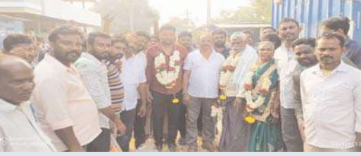
కోదాడ అక్షయ ప్రతినిధి