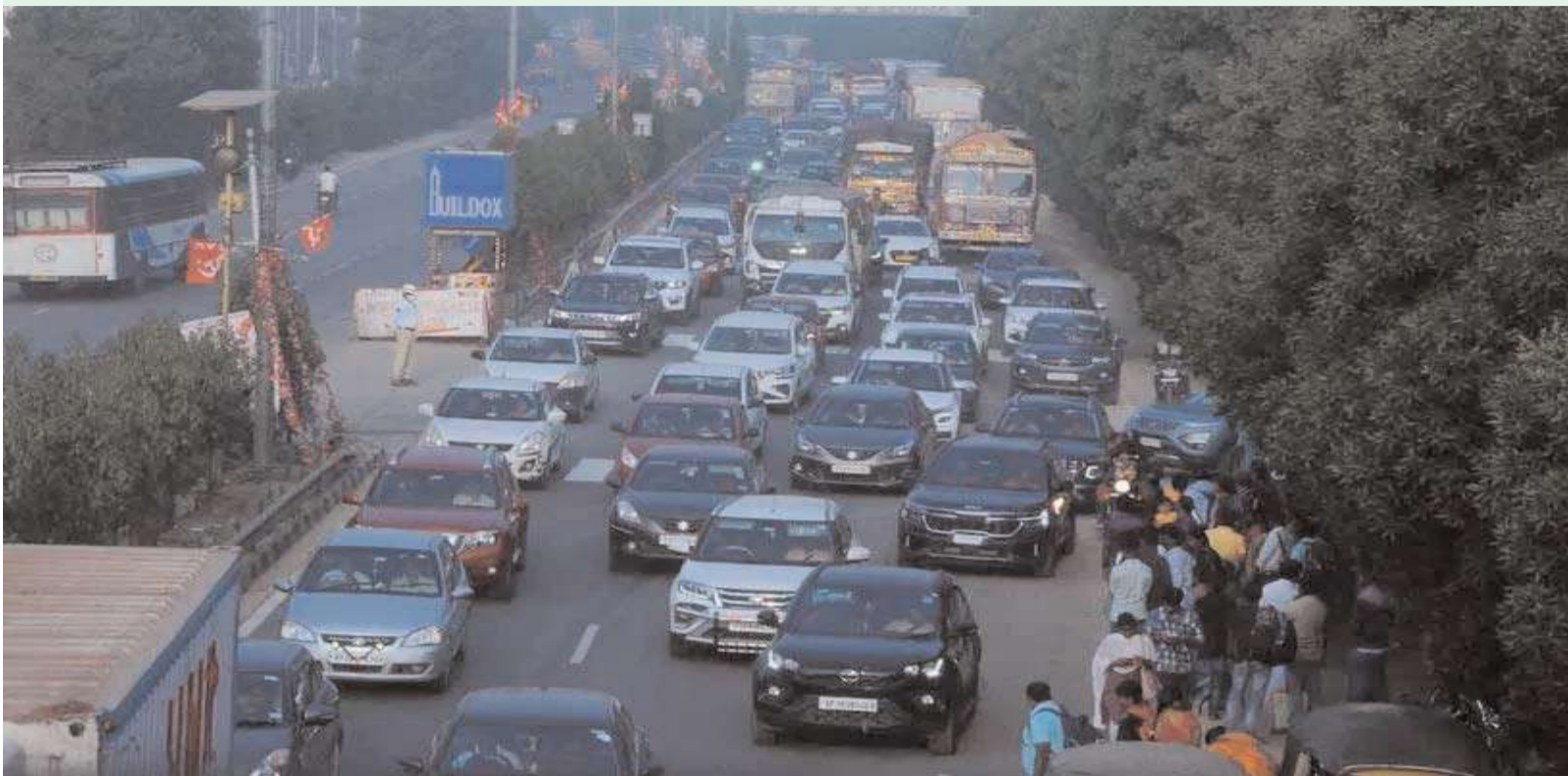
సొంతూళ్లకు బయలదేరిన వందలాది వాహనాలు