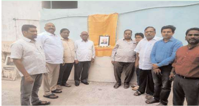
జనగామ, అక్షయ ప్రతినిధి: