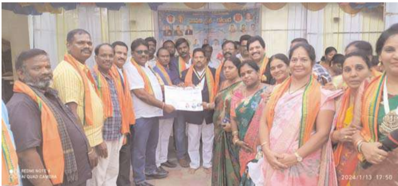
కోదాడ అక్షయ ప్రతినిధి