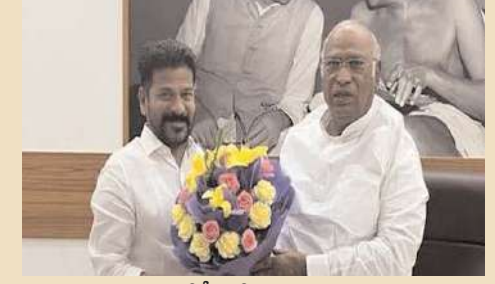
న్యూఢిల్లీ, అక్షిత ప్రతినిధి :

విజ్ఞాన అభ్యర్థుల మల్లిఖార్జున ఖర్గే నివాసంలో కాంగ్రెస్ నేతలు సమావేశమయ్యారు. ఈ సమావేశంలో ఆ పార్టీ అగ్రనేత రాహుల్ గాంధీ, తెలంగాణ సీఎం రేవంత్ రెడ్డి, రాష్ట్ర కాంగ్రెస్ ఇన్ ఛార్జ్ దీపాదాస్ మున్నీ పాల్గొన్నారు. తెలంగాణలో ఎమ్మెల్సీ ఎన్నికలు, అభ్యర్థుల ఖరారు, ఖాళీగా ఉన్న మంత్రి పదవులపై