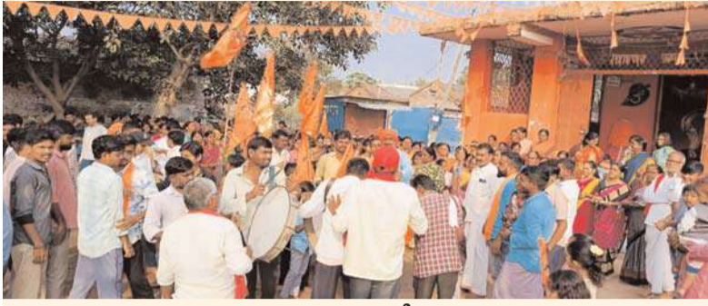
అదిలాబాద్ బ్యూరో అక్షిణి:-