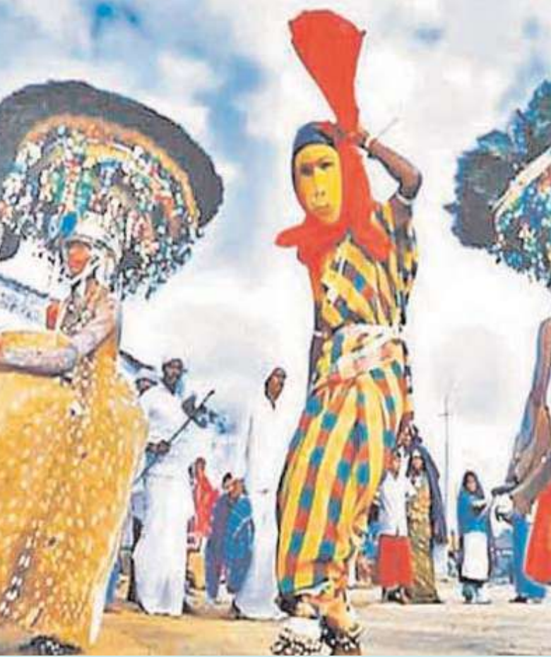
కేంద్ర సర్కారు.. ఏపీలో 2019లోనే గిరిజన విశ్వవిద్యాలయాన్ని నెలకొల్పింది. ఇటు తెలంగాణలో గిరిజన విశ్వవిద్యాలయం ఏర్పాటు అంశాన్ని మాత్రం నిర్లక్ష్యం చేసింది.

అక్షర జ్ఞానానికి ఆమడదూరంలోనే ఉండిపోయిన అదివాసులు అందరినీ ఎక్కేందుకు తోవ దొరికింది. విజ్ఞానసముద్రానంద బిశాఖ మరల వేగంగా అడుగులు వేసేందుకు మార్గం సుగమమైంది. విభజన చట్టంలో ఇచ్చిన హామీ మేరకు తెలంగాణలో కేంద్రీయ గిరిజన వర్సిటీ ఏర్పాటుకు భారత ప్రభుత్వం వచ్చడంపై ఆనంది. అదివాసీల ఆరాధ్య దైవాలైన సమ్మక్క-సారక్క పేరు ములుగు జిల్లాలో ఈ జాతీయస్థాయి విశ్వవిద్యాలయాన్ని కేంద్రం నెలకొల్పనున్నది. గిరిజన వర్సిటీకి సంబంధించిన జిల్లా పార్లమెంట్ లోని ఉభయసభల్లో పాసి అవగా, రాష్ట్రపతి ఆమోదం కోసం పంపారు. ములుగు జిల్లా కేంద్రంలో గిరిజన కేంద్రీయ విశ్వవిద్యాలయం ఏర్పాటుకు సంబంధించిన జిల్లా సమన్వయ కమిటీలో కేంద్రమంత్రి ధర్మేంద్ర ప్రధాన్ ప్రవేశపెట్టారు. ఈ యూనివర్సిటీ పేరును కేంద్ర విశ్వవిద్యాలయాల జాబితాలో చేర్చుతూ ఇప్పటిదాకా ఉన్న చట్టానికి సవరణ చేయాలని ప్రతిపాదించారు. 2009 సెంట్రల్ యూనివర్సిటీల చట్టాన్ని సవరించి సమ్మక్క-సారక్క విశ్వవిద్యాలయాన్ని అందులో చేర్చనున్నట్లు జిల్లాలో పేర్కొన్నారు. ఉమ్మడి ఏపీ నుంచి తెలంగాణ వేరుపడ్డ సందర్భంలో కేంద్ర ప్రభుత్వం రూపొందించిన చట్టం పేరు ఆంధ్రప్రదేశ్ పునర్విభజన చట్టం-2014. ఆ చట్టంలో పొందుపర్చిన హామీల్లో ఉభయ రాష్ట్రాల్లో గిరిజన విశ్వవిద్యాలయాల ఏర్పాటు అంశం ఒకటి. ఆ చట్టాన్ని అనుసరించి