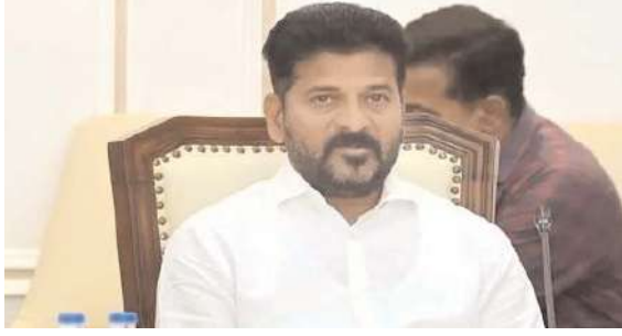
హైదరాబాద్, అక్షిత ప్రతినిధి :

తెలంగాణ ప్రజలందరికీ ముఖ్యమంత్రి ఎస్ఎంఎం రేవంత్ రెడ్డి మకర సంక్రాంతి శుభాకాంక్షలు తెలిపారు. శనివారం నాడు ఈ మేరకు ఓ ప్రకటన విడుదల చేశారు. పాత నిర్బంధపు చీకట్లను రూపుమాపే కొత్త కాంతులు ఇంటింటా వెల్లివిరియాలని ఆశాభావం వ్యక్తం చేశారు. సూర్యుని కొత్త ప్రయాణం కొత్త మార్పుకు నాంది పలకాలని, రాష్ట్రమంతటా సంక్షేమంతో పాటు అభివృద్ధి వెలుగులు విరజిల్లాలని అన్నారు. భోగ భాగాలను అందించే భోగి.. కొత్త కాంతులు తెచ్చే సంక్రాంతి.. కనుమ పండుగలు.. అందరూ ఆనందంగా జరుపుకోవాలని మనసారా ఆకాంక్షించారు. తెలంగాణలో మొదలైన ప్రజా పాలనలో స్వేచ్ఛా సౌభాగ్యాలతో ప్రజలు సంతోషంగా పండుగ సందబారాలు జరుపుకోవాలని తెలిపారు.