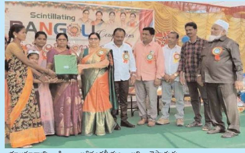
యాజమాన్యాన్ని కి అభినందనీయం అని చెప్పారు