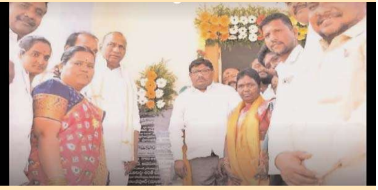
అక్షితన్యూస్ ఫుట్వేసర్ బుధవారం 24