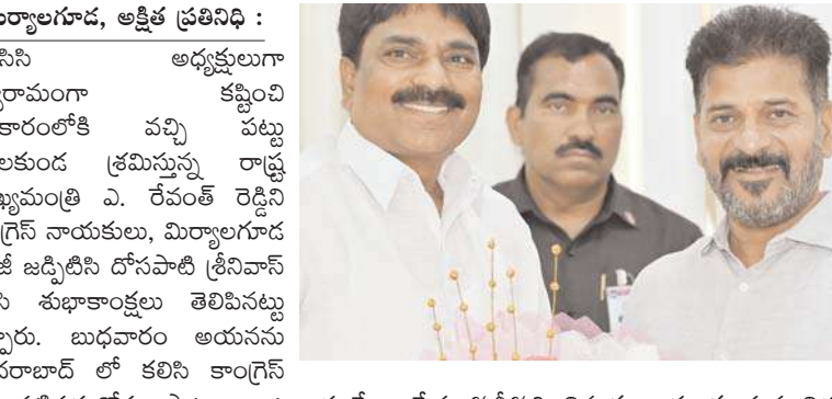
మిర్యాలగూడ, అక్షయ ప్రతినిధి :