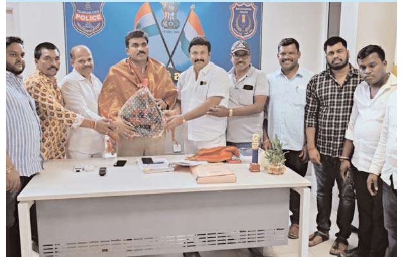
రంగారెడ్డి అక్షయ ప్రతినిధి:

సిఐని శాలువతో ఘనంగా సన్మానించిన కాంగ్రెస్ శ్రేణులు