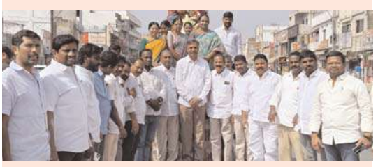
జనగామ, అక్షిత ప్రతినధి: