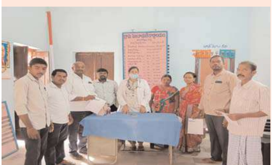
అడవిచెవులపల్లి, అక్షిత ప్రతినధి: