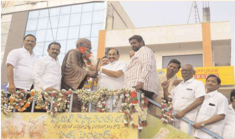
సూర్యాపేట/ అక్షిత ప్రతినిధి: