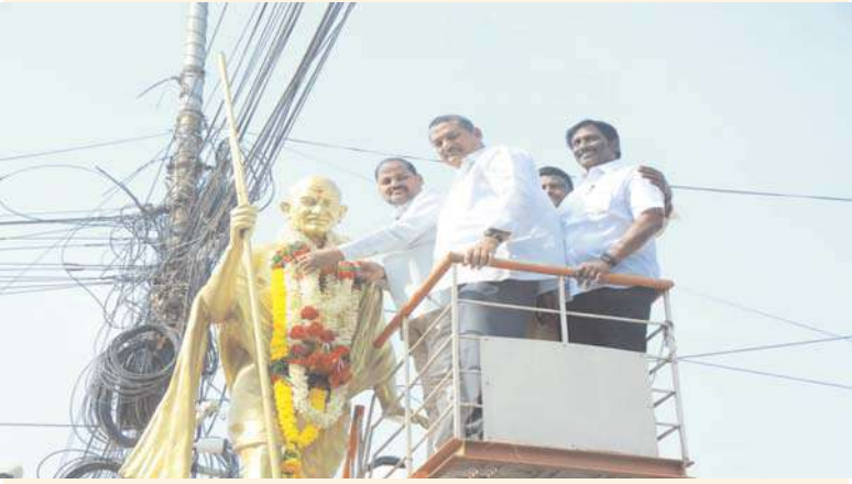
మిర్యాలగూడ, అక్షిత ప్రతినిధి :