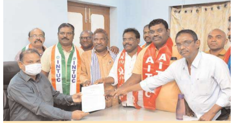
వరంగల్, అక్షిత బ్యూరో: