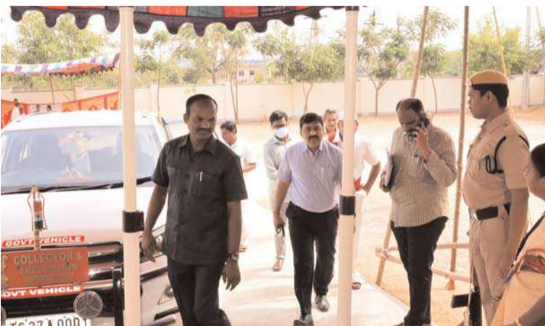
జనగామ, అక్షిణి ప్రతినిధి: