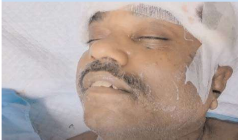
అక్షితులైన ఘట్టేసర్ శనివారం 10