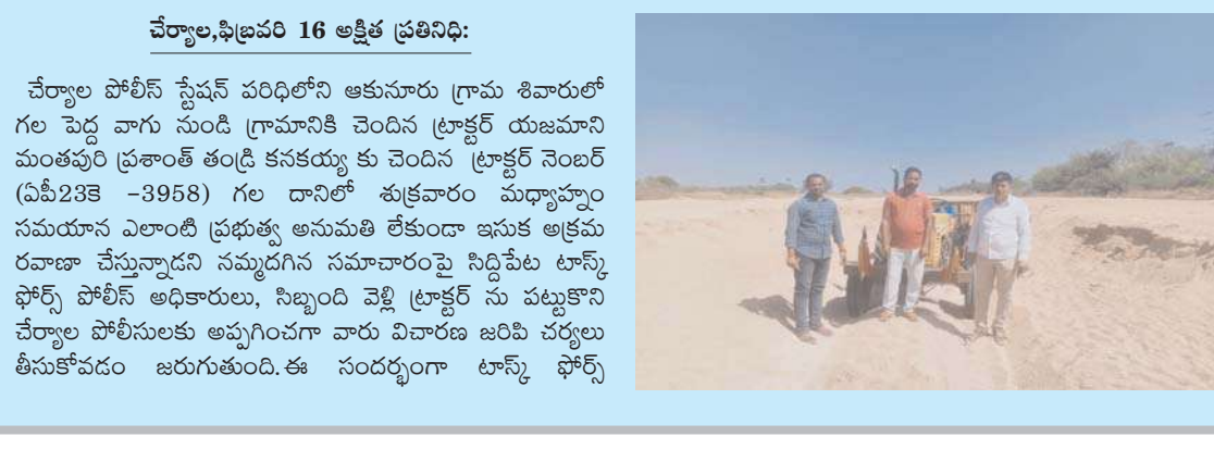
చేర్యాల,ఫిబ్రవరి 16 అక్షిణి ప్రతినిధి: