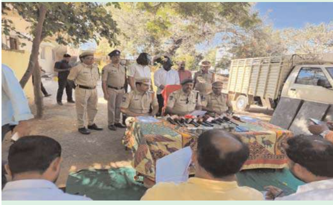
సకిచేకట్ అక్షిణి ప్రతినిధి

15 రోజుల వ్యవధిలో 7 చోరీల చోరీ చోరీకి పాల్పడిన వారిలో ముగ్గురు మైనర్లు