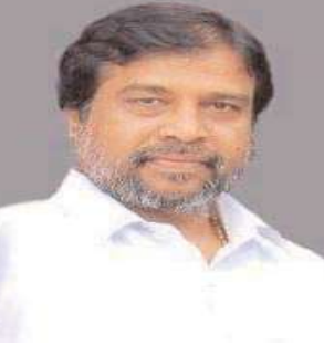
అందోలు, అక్షిత ప్రతినిధి:

రాష్ట్ర వైద్య ఆరోగ్య కుటుంబ సంక్షేమ శాఖ మంత్రి దామోదర్ రాజునగర్ శనివారం జోగిపేట మున్సిపాలిటీ పరిధిలో పర్యటించనున్నారు. శనివారం పుణ్యస్నానం 1 గంటలకు పట్టణములోని శ్రీ వేంకటేశ్వర ఫంక్షన్ హాల్లో పట్టణములోని వివిధ కుల సంఘాలతో మరియు వ్యాపారస్తులతో పట్టణ అభివృద్ధి కోసం ముఖ్యముఖి కార్యక్రమములో పాల్గొనున్నారు. ఈ కార్యక్రమం ద్వారా జోగిపేట మున్సిపాలిటీ అభివృద్ధిలో పాలు ప్రజా సమన్వయ పై పట్టణ ప్రజలతో మంత్రి నేరుగా మాట్లాడి తెలుసుకొనున్నారు. కాపున పట్టణ వివిధ కుల సంఘాల మరియు వ్యాపారస్తులు ఈ కార్యక్రమములో పాల్గొనాలని పట్టణ కాంగ్రెస్ నాయకులు కోరారు.