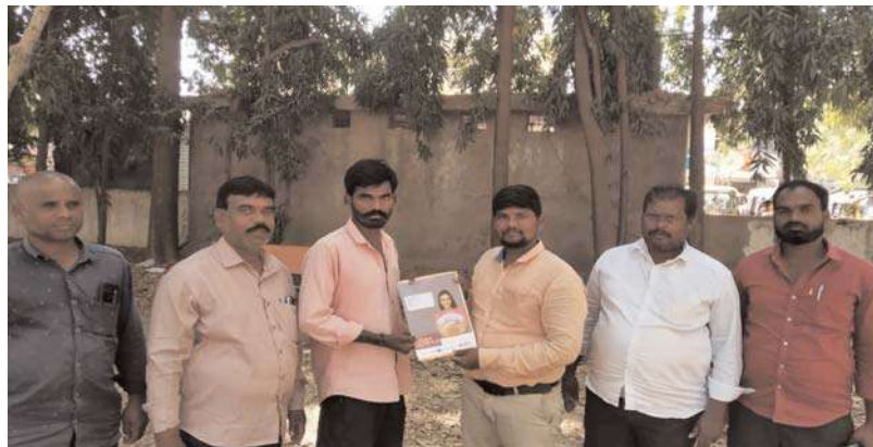
అందోలు, అక్షిత ప్రతినిధి :