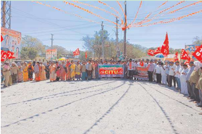
నకిరేకల్ అక్షత ప్రతినిధి

గ్రామీణ బండ్ సందర్భంగా సిఐటియు ఆధ్వర్యంలో ర్యాలి