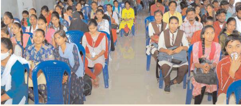
నల్గొండ, అక్షిత ప్రతినిధి :