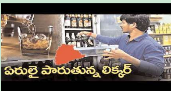
విరుల్ల పారుతున్న లిక్కర్

మండలంలో బెల్ షాప్ ల నిర్వహణ జోరుగా కొనసాగుతోంది. మండల పరిధిలో 24 గ్రామాలు ఉండగా ప్రభుత్వం నాలుగు వైన్స్ షాపులు మంజూరు చేసింది. మండల కేంద్రంలోనే నాలుగు షాపులు ఉన్నవి. మండల పరిధిలోని గ్రామాల్లో వీధివీధినా బెల్ దుకాణాలు దర్శనం ఇస్తున్నాయి. ఓ గ్రామంలో 20 కి పైగా బెల్ దుకాణాలు