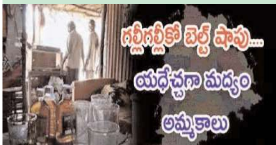
గట్టిగట్టి బెల్ షాపు... యథేచ్ఛగా మద్యం అమ్మకాలు

నుంచి కొద్ది దూరం మాత్రమే మద్యం సరఫరా చేయాల్సి ఉంటుంది. అది కూడా రిటైల్ లో కొనుగోలు చేయాల్సిందే తప్ప హోల్ సెల్ లో సరఫరా చేయడానికి వీల్లేదు. నిబంధనల ప్రకారం ఒక వ్యక్తి ఐదు లీటర్ల వరకు మాత్రమే మద్యం తరలించడానికి అనుమతి ఉంది. కానీ ఇవేమీ పట్టించుకోకుండా వైన్స్ యజమానులు ప్రతి ఊరిలో ఉన్న బెల్ షాపులకు వందల సంఖ్యల్లో మద్యం బాటిల్లు తరలిస్తున్నారు. ఇదేమని అడిగే నాభుడే లేదు. బెల్ షాపులపై ఎలాంటి మార్గదర్శకాలు లేకపోయినా గ్రామాల్లో విచ్చలవిడిగా నిర్వహిస్తున్నారు. వీరికి రాజకీయ నాయకుల అందరి ఉండటంతో అధికారులు చూసచూడనట్లు వ్యవహరిస్తున్నారు. మద్యం విక్రయాలపై పలుమార్లు గ్రామాల్లో ఫిర్యాదులు చేసినా ఎక్సైజ్ అధికారులు, పోలీసులు పట్టించుకోకపోవడంపై అనుమానాలు వ్యక్తం అవుతున్నాయి. ఇప్పటికైనా స్పందించి బెల్ షాపులకు అక్రమంగా తరలిస్తున్న వైన్స్ షాపులపై చర్యలు తీసుకోవాలని ప్రజలు కోరుతున్నారు.