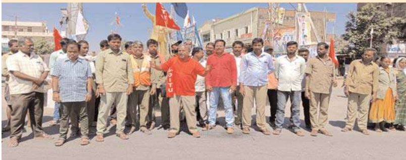
కేంద్రం, అక్షిత ప్రతినిధి :

కేంద్రం తీరును ఎండగట్టిన కార్మిక సంఘాల నేతలు