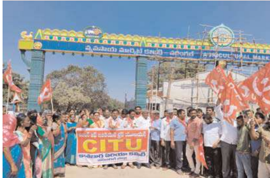
వరంగల్, అక్షిత జ్యూరో:

దేశవ్యాప్త కార్మిక కర్షక సమ్మె లో భాగంగా సిఐటీయూ ఆధ్వర్యంలో యాదగిరి ఆధ్వర్యంలో వరంగల్ ఎనుమాముల మార్కెట్ ముందు కార్మికులు రైతుల తో నిరసన వ్యక్తం చేశారు. కార్యక్రమం లో సీఐటీయూ నాయకులు పాల్గొన్నారు.