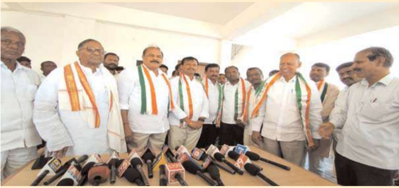
-నైతిక విజయం నాదేనన్న కొమ్మూరి