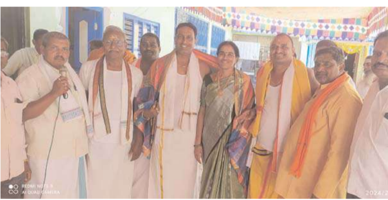
కోదాడ అక్షిత ప్రతినిధి

కోదాడ పట్టణంలో మాజూర్నగర్ రోడ్డు షైట్ వర్ సమీపంలో గల ప్రసిద్ధిగాంచిన అయ్యప్ప స్వామి దేవాలయం 21వ వార్షికోత్సవాన్ని గుడి కమిటీ సభ్యులు ఘనంగా నిర్వహించారు స్వామివారికి ఉదయాన్నే అభిషేకాలు వివిధ రకాల పూలతో పూజా కార్యక్రమాలు నిర్వహించారు శబరిమలైలో జరిగే విధంగా స్వామి వారి ఉత్సవ విగ్రహాన్ని దేవాలయం నుండి ఊరేగింపుగా రామ్మూర్తి నగర్ లో గల బావి వద్ద స్నానాలు చేయించి ఆరట్టు ఉత్సవం ను ఘనంగా నిర్వహించారు అదేవిధంగా సుబ్రహ్మణ్యస్వామికి మాలిక పురతర అయ్యప్ప స్వామికి అష్టారశ కలిశాభిషేకం వేద పండితులచే ఘనంగా నిర్వహించారు