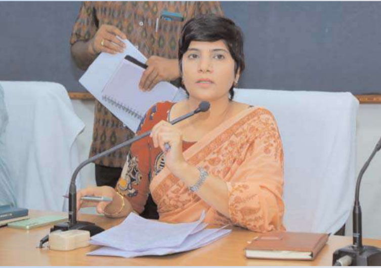
నల్గొండ, అక్షిత ప్రతినిధి :

ప్రజావాణి ద్వారా స్వీకరించిన ఆర్డీలను జాప్యం లేకుండా పరిష్కరించాలని జిల్లా కలెక్టర్ హరిచందన్ దాసరి అధికారులను ఆదేశించారు. ప్రజావాణి కార్యక్రమంలో భాగంగా సోమవారం ఆమె జిల్లా కలెక్టర్ కార్యాలయంలోని సమావేశ మందిరంలో ప్రజల వద్ద నుండి వారి సమస్యలపై ఆర్డీలను స్వీకరించారు. ఈ