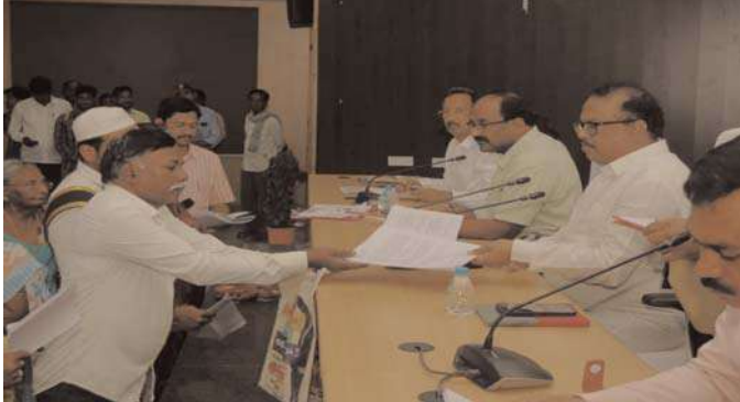
సూర్యాపేట/ ఆక్షిత ప్రతినిధి: