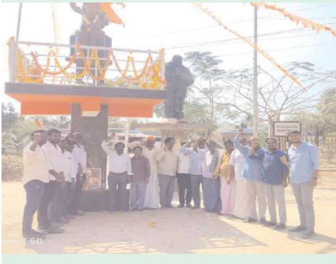
కోడంగల్, ఆక్షిత ప్రతినిధి: