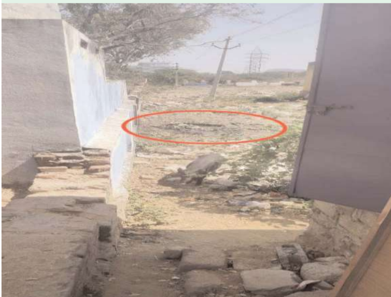
సకిరేకల్ అక్షిత ప్రతినిధి

పాఠశాలలు రేపటి దేశ భవిష్యత్ కి పునాదులు.. విద్యార్థి ప్రాథమిక విలువలు నేర్చుకునేది ఇక్కడే. ప్రభుత్వాలు మారుతున్నా.. విద్యార్థులను తీర్చిదిద్దే పాఠశాలల పరిస్థితులు మాత్రం మారడం లేదు. విద్యార్థులకు మౌలిక వసతులు కల్పించాలని ఉన్నప్పటికీ అవసరాలకు అనుగుణంగా మరుగుదొడ్లు, తాగునీటి వసతులు కల్పించాలని సుప్రీంకోర్టు ఆదేశించినా.. పాఠశాలల దుస్థితి మారడం