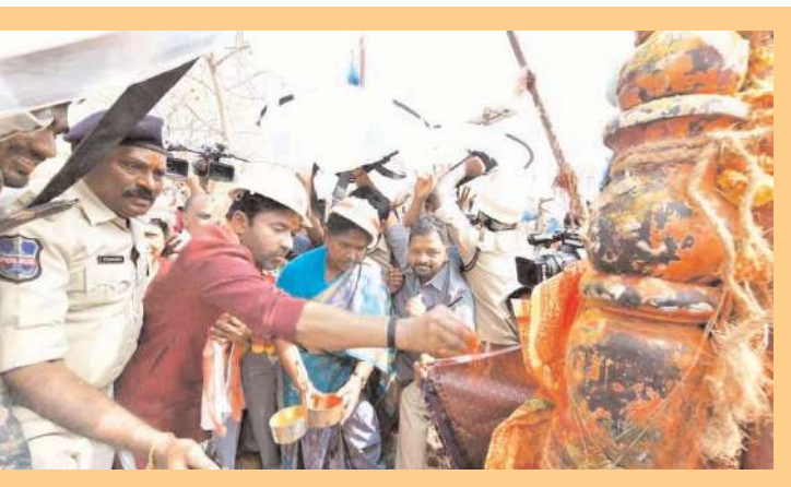
గుర్తింపు కోసం రాబోయే రోజుల్లో ప్రయత్నిస్తామన్నారు.

మేదారం మహా జాతర సందర్భంగా సమృద్ధి సారలమ్మలను కేంద్ర మంత్రి కిషన్ రెడ్డి వందేవతలను దర్శించు కున్నారు. తల్లులకు నిలువెత్తు బంగారాన్ని సమర్పించారు. ఈ సందర్భంగా ఆయన మీడియాతో మాట్లాడారు. ప్రకృతి వైపరీత్యాలు లేకుండా పాడి పంటలతో దేశం అంత సుభిక్షంగా ఉండాలని అమ్మ వారికి మొక్కులు చెల్లించుకున్నానని తెలిపారు. అలాగే ములుగులో గిరిజన వర్షిణీ తాత్కాలిక క్యాంపస్ ఏర్పాటు చేస్తామన్నారు. హైదరాబాద్ కేంద్రీయ వర్షిణీ ఆధ్వర్యంలో గిరిజన వర్షిణీ పని చేస్తుందని తెలిపారు. మేదారం జాతరను జాతీయ పండుగగా నిర్వహించాలని చాలా మంది అడుగుతున్నారు. జాతీయ పండుగ విధానం అనేది ఎక్కడా లేదన్నారు. మేదారానికి అంతర్జాతీయ