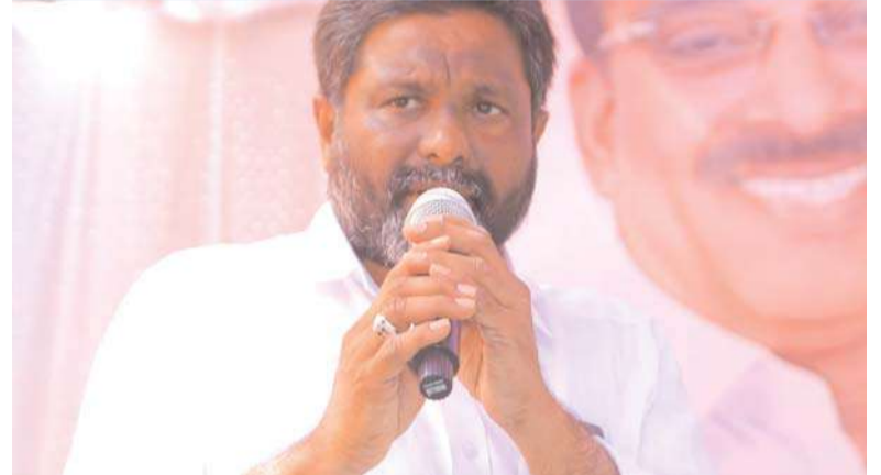
ఖమ్మం/ అక్షిత బ్యూరో :