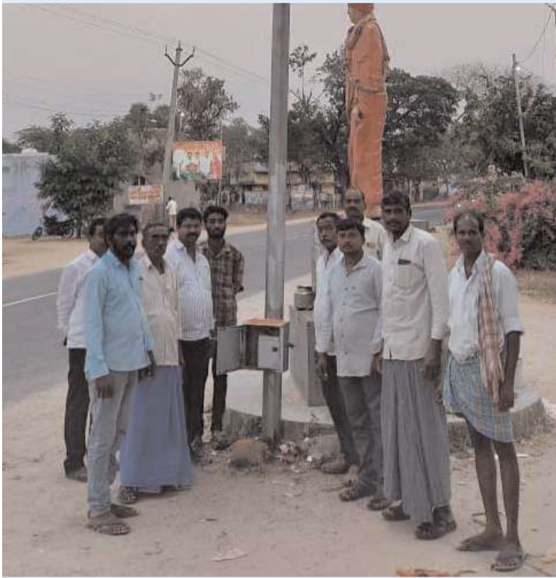
నకిరేకల్ అక్షిత ప్రతినిధి

మండలంలోని బోగారం గ్రామం వివేకానంద విగ్రహం సెంటర్లో గత కొన్ని సంవత్సరాలుగా వెలుగులు లేకుండా హైమాస్ట్ లైట్లు