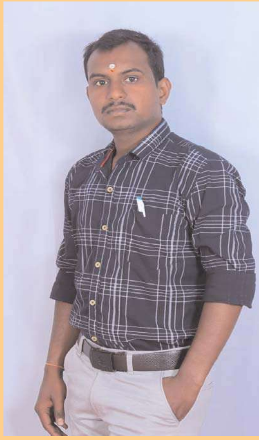
దురదృష్టకరం. . !

విద్యార్థులలో మానవతా విలువలు మర్చిపోవాల్సిందేనా...? విద్యార్థులకు నైతిక విలువలు కలిగి ఉన్నాయా...? విద్యార్థులకు సామాజిక బాధ్యత ఉందా...? ఉపాధ్యాయులా..? తల్లిదండ్రులా.. ....? ప్రభుత్వమా.....?