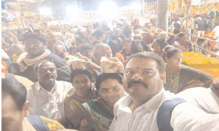
జనగామ, అక్షయ ప్రతినిధి:

గుడి లేదు-గోపురం లేదు.. అర్చన లేదు-అభిషేకం అంత కన్నాలేదు.. తీర్థం లేదు-తీయని లడ్డు లేదు.. మడి లేదు-మంగళహారతి లేదు.. కొలవడానికి ఓ రూపం లేదు.. కలవడానికి ప్రత్యేక దారులేవు.. ఉన్నదొక్కటే నమ్మకం లి"అమ్మా" అంటే.. నేనున్నా బిడ్డా అనే నమ్మకం... ఆ నమ్మకమే అడవిబిడ్డల ఆరాధ్య దైవం లిమహాజనుల జాతర "నమ్మకం సారక" చీమకుట్టడు పాము పుట్టడు ఎక్కడపడితే అక్కడ తండోపతందాలుగా గుడారాలు... నమ్మకమే మన భారతీయత... ఇదే సనాతన ధర్మం అందించిన