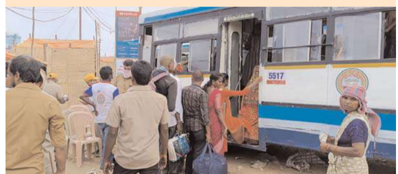
పరంగల్, అక్షత బ్యూరో:

ఆసియాలోనే అతిపెద్ద జాతరగా పేరు గాంచిన మేడారం సమ్మక్క సారలమ్మ జాతర కు దేశం నలుమూలల నుండి భక్తులు పోతెత్తి వచ్చారు.నాలుగు రోజులుగా మేడారం పరిసర ప్రాంతాలు