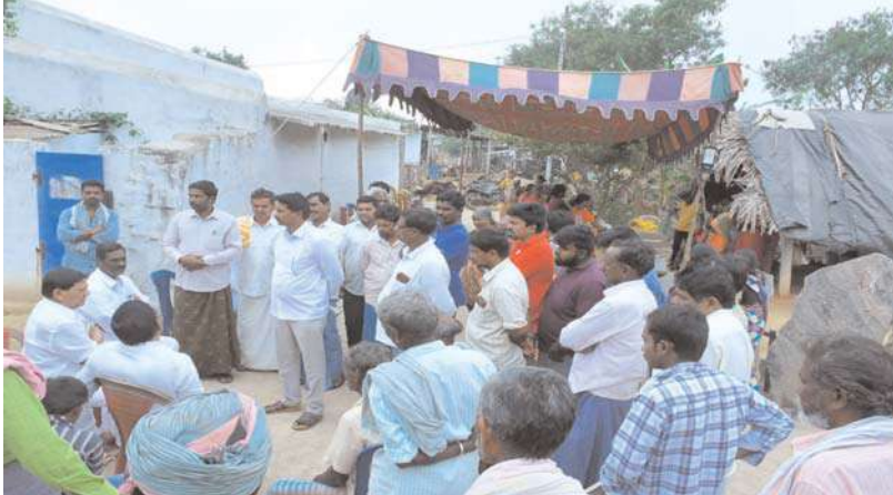
వేములపల్లి అక్షిత ప్రతినిధి: