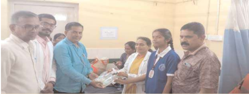
అందోలు, అక్షిత ప్రతినిధి :