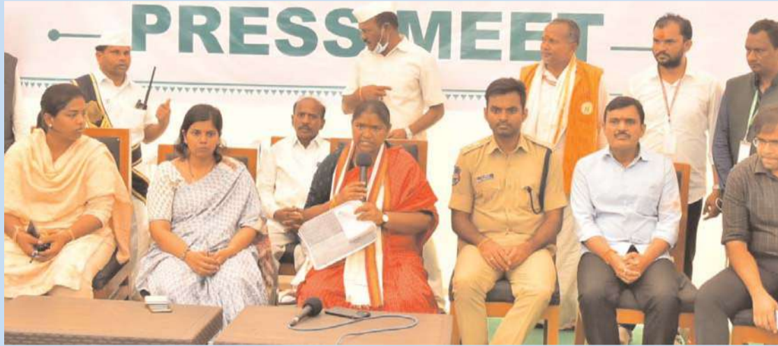
వరంగల్, అక్షిత బ్యూరో:

జాతర నిర్వహణకు అత్యధిక నిధులు ఇచ్చిన రాష్ట్ర ముఖ్యమంత్రికి, ఉప ముఖ్యమంత్రి బట్టి విక్రమార్కు కు, మంత్రులకు రాష్ట్ర ప్రభుత్వానికి ధన్యవాదాలనీదేవదాయ మంత్రి కొండా సురేఖ రవాణా శాఖ మంత్రికి ప్రత్యేక ధన్యవా