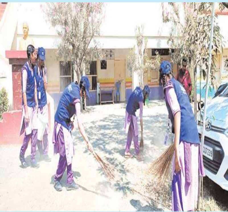
'ఐక్యత' మంచి ఆలోచన

ప్రధానోపాధ్యాయుడిగా పనిచేసే ఉద్యోగ విరమణ పొందాడు. మానవతా విలువలు నేటి సమాజంలో తక్కువగా ఉండటాన్ని గమనించాం. మా వంటుగా విలువలను పెంపొందించే కృషిని చేస్తున్నాం. ఆలో తరగతి నుంచే పిల్లలకు విలువల గురించి తెలియజేయాలన్న అవసరం ఎంతైనా ఉంది.