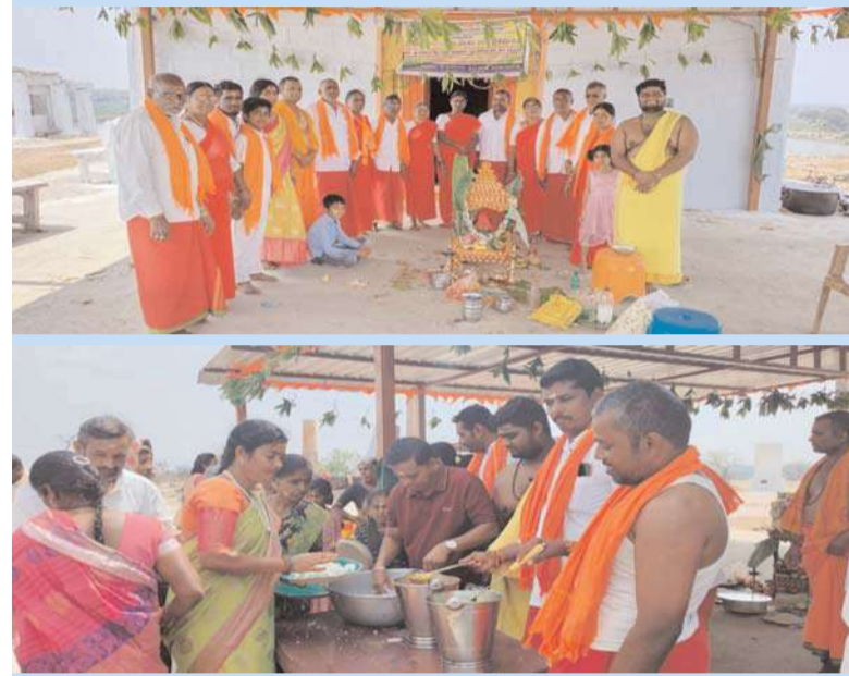
జనగామ, అక్షయ ప్రతినిధి: