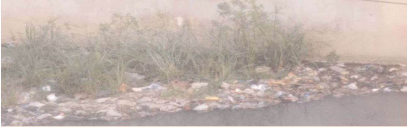
అక్షయ న్యూస్, మాడుగుల పల్లి:

కోరుకుంటున్నారు. అలానే నకిలీ ఆర్ఎంపీ వైద్యం చేస్తున్న వారిపై కఠిన చర్యలు తీసుకోవాలని ప్రజలు వేడుకుంటున్నారు. మాడుగులపల్లి, కుక్కడం, బొమ్మకల్, తోపుచర్ల గ్రామాలలో మెడికల్ షాపులలో లైసెన్సులు లేకుండా వారి ఇష్టానుసారంగా వైద్యం చేస్తూ, మందులు అమ్మడం జరుగుతుందని పలుమార్లు పై అధికారులకు తెలియజేసిన కూడా లాభం లేకపోవడం ప్రజలు ఇబ్బందులకు గురవుతున్నారు. ఇది ఇలా ఉండగా రక్త పరీక్షలు చేస్తేనే ఏ వ్యాధి ఉందో తెలుస్తది అంటూ ఆర్ఎంపీలే రక్త పరీక్షలకు రాస్తూ మండల