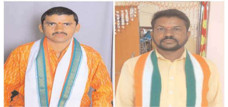
జనగామ, అక్షయ ప్రతినిధి:

ఇచ్చిన మాట నిలబెట్టుకునే కాంగ్రెస్ ప్రభుత్వం....!!