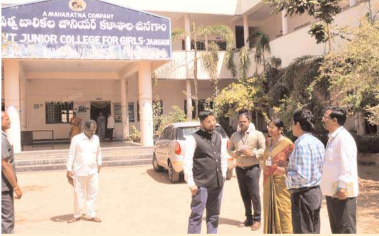
జనగామ, అక్షిత ప్రతినిధి: