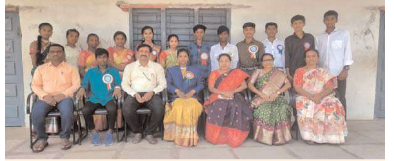
జనగామ, అక్షిత ప్రతినిధి: