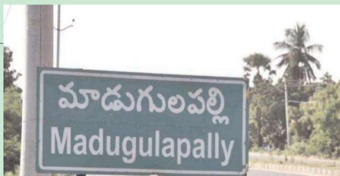
అక్షిత న్యూస్, మాడుగుల పల్లి:

పారిశుధ్యం పల్లెల్లో పడకేసింది. పల్లెలు సీజనల్ వ్యాధులకు ఆలవాలంగా నిలుస్తున్నాయి. గ్రామాల్లో పారిశుధ్యం లోపం చడంతో సీజనల్ వ్యాధులు విజృంభిస్తున్నాయి. మరిముఖ్యంగా విషజ్వరాలతో ప్రజలు అల్లాడుతున్నారు. మురికి గుంటలను దోమలు ఆవాసంగా చేసుకుంటున్నాయి.