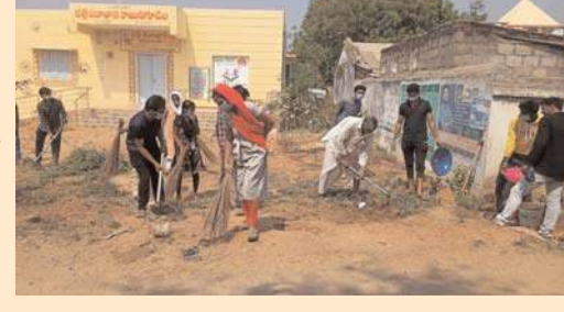
అక్షయ స్కూల్ రాయపల్లి (దేవరపల్లె)