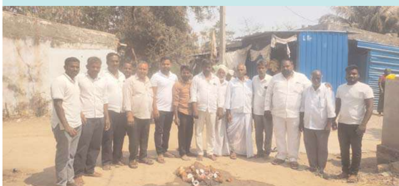
అందోలు, అక్షయ ప్రతినిధి :