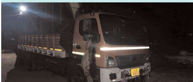
దామరపల్లె, అక్షయ ప్రతినిధి :