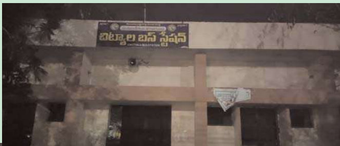
Mar 3, 2024 6:59:05 PM Chityala Telangana