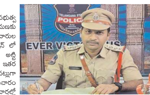
వరంగల్, అక్షయ బ్యూరో: