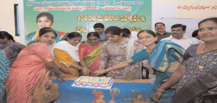
అక్షయ స్కూల్ రాయపల్లి

కిసాన్ సమృద్ధి యోజన, కళ్యాణ లక్ష్మి, షాదీ ముబారక్ చెక్కులు పంపిణీ