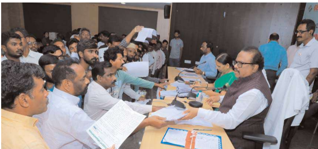
సూర్యాపేట / అక్షిత ప్రతినిధి:

ప్రజా పాలన దరఖాస్తుల పరిశీలనపై వేగం పెంచండి. జిల్లా కలెక్టర్ ఎస్. వెంకట్రావ్.