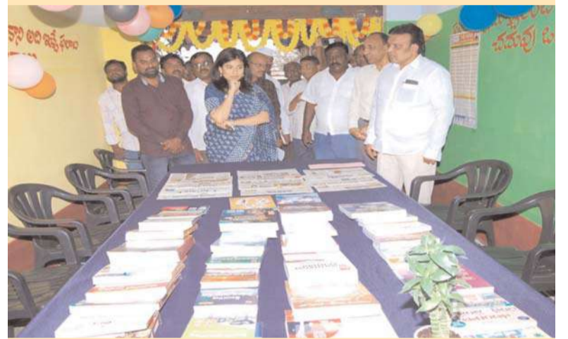
చేర్యాల,మార్చి 4 అక్షిత ప్రతినిధి: