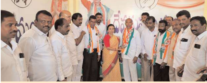
అక్షయ స్కూల్ రాయపల్లి (దేవరపల్లె)