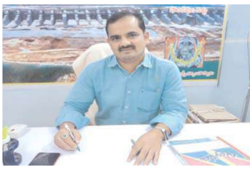
వరంగల్, అక్షయ బ్యూరో: