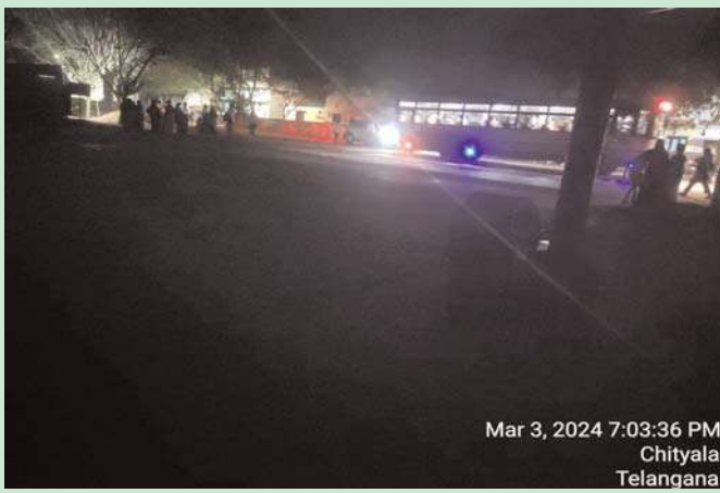
Mar 3, 2024 7:03:36 PM Chityala Telangana

నల్గొండ జిల్లా నకిరేకల్ నియోజకవర్గం చిట్టాల మునిసిపల్