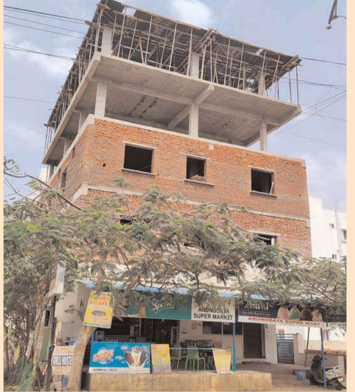
అక్షతన్యూస్ ఫుటేజీ సోమవారం 4

ఫుటేజీ మండల్ వెంకటపూర్ లో అక్రమ పెంట్ హౌస్ నిర్మాణాలు జోరుగా సాగుతున్నాయి వెంకటపూర్లో అక్రమ అంతస్తులు హైదరాబాదును తలపిస్తున్నాయి గ్రామ సెక్రటరీ ఏ లాంటి చర్యలు తీసుకోవడం లేదని వెంకటపూర్ గ్రామ ప్రజలు అనుకుంటున్నారు ప్రభుత్వ ఆదానికీ గండి కొడుతున్న అధికారులు చూసి చూడనట్టు ఉండడం అనుమానానికి తావిస్తుంది ఇప్పటికైనా అధికారులు స్పందించి ఈ అక్రమ నిర్మాణాలను కూల్చివేయాలని స్థానికులు కోరుకుంటున్నారు.