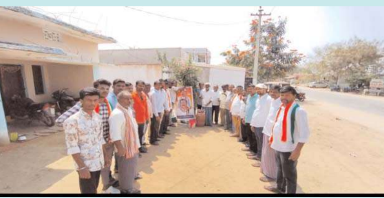
జనగామ, అక్షయ ప్రతినిధి: