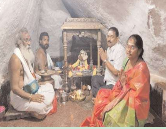
నకిరేకల్ అక్షయ ప్రతినిధి