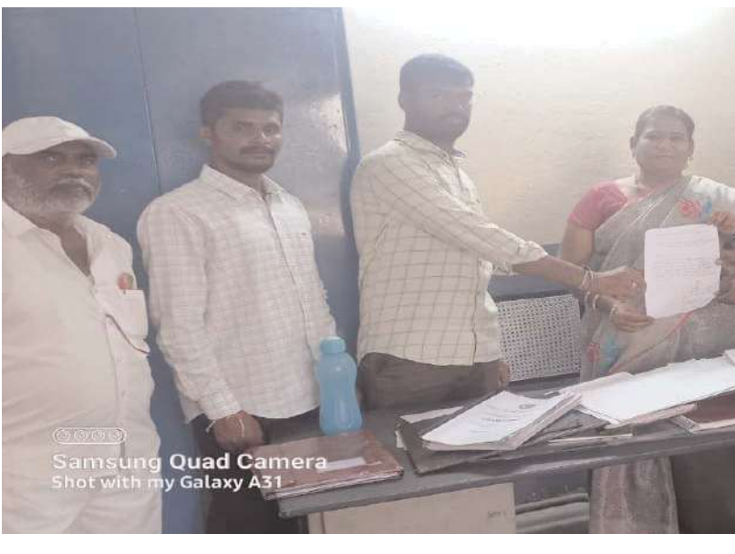
చిన్నకోడూరు, మార్చి 6, అక్షయ స్వస్థి: