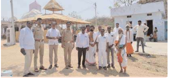
నకిరేకల్ అక్షయ ప్రతినిధి