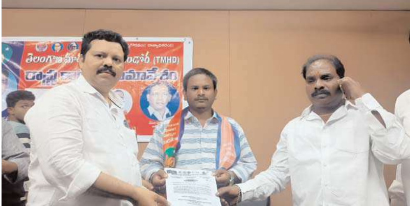
శేరిలింగంపల్లి అక్షయ ప్రతినిధి: