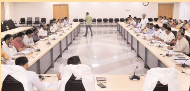
వంద శాతం పన్నులు వసూలు చేయాలి

సర్పరీల్లోని మొక్కలకు ఎప్పటికప్పుడు నీరు అందించాలని, ఫెన్సింగ్ పనులు పక్కన ఉన్న పూర్తి చేయాలని అన్నారు. పల్లె ప్రకృతి వనాలు, వైకుంఠథామాల్లో పిచ్చి మొక్కలను తీయించాలన్నారు. పచ్చదనానికి మొక్కలను నాటి, నీరు అందించి వాటిని పర్యవేక్షించాలని వివరించారు. ఈ నెల 26 లోపు ఎంపిడిఓలు రిపోర్ట్ ఇవ్వాలని తెలిపారు.