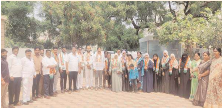
శేరిలింగంపల్లి అక్షత ప్రతినిధి..