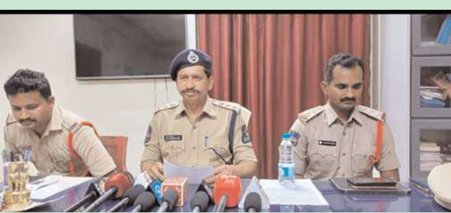
జనగామ, అక్షిత ప్రతినిధి: