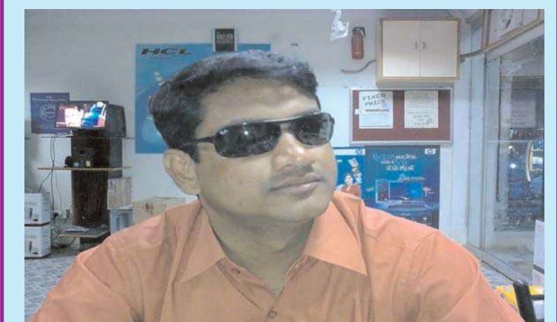
హైదరాబాద్, అక్షయ ప్రతినిధి :