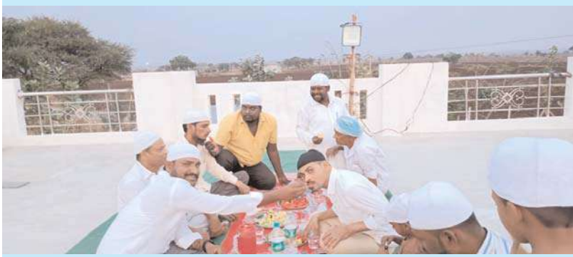
కోడంగల్, అక్షయ ప్రతినిధి :