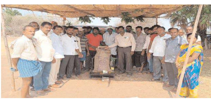
జనగామ, అక్షయ ప్రతినిధి:

రైతుల పడించిన వరి ధాన్యాన్ని ప్రభుత్వం ఏర్పాటు చేసిన కొనుగోలు సెంటర్లలోనే విక్రయించాలని ఎంపీడివో రఘురామకృష్ణ తెలిపారు. జనగామ జిల్లా బచ్చన్నపేట మండలంలోని కేశిరెడ్డి పల్లి, బండ నాగారం గ్రామాల్లో వివివివి ఆధ్వర్యంలో ఏర్పాటు చేసిన ధాన్యం కొనుగోలు కేంద్రాన్ని రైతులతో కలిసి గురువారం రోజున ఆయన ప్రారంభించారు. రైతులకు ఎలాంటి ఇబ్బందులు కలవకుండా అన్ని నడుపాయాలు చేస్తూ ప్రభుత్వం ప్రకటించిన ధరకు విక్రయించి రైతులందరూ కొనుగోలు కేంద్రంలోనే విక్రయించాలన్నారు. అర్ధి వ్యాపారులకు ఇచ్చి దశాబ్దాల వద్ద మోసపోవద్దన్నారు... కనీస మద్దతు ధర ఏ గ్రేడ్ ధర: 2203, కామన్ గ్రేడ్ ధర: 2183 పొందవచ్చు అన్నారు.