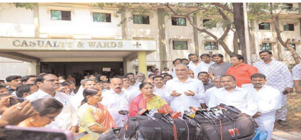
సంగారెడ్డి, అక్షయ ప్రతినిధి :