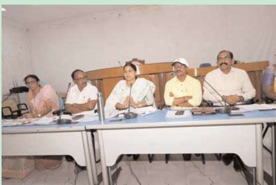
లో పాఠశాలల్లో సమస్యల పరిష్కారం జరగాలని, మే