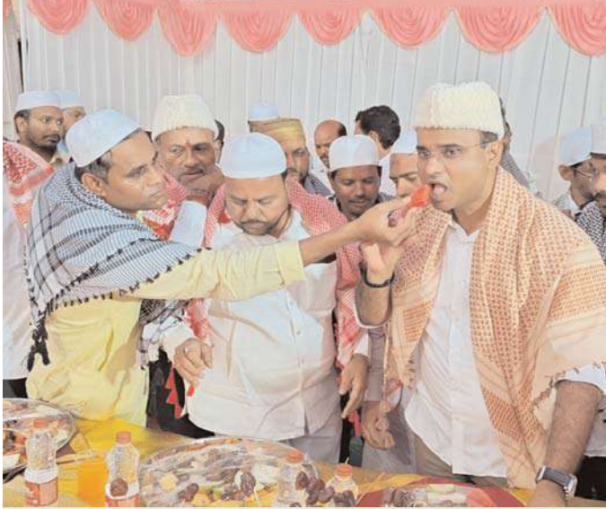
మేడల్, అక్షయ బ్యూరో: