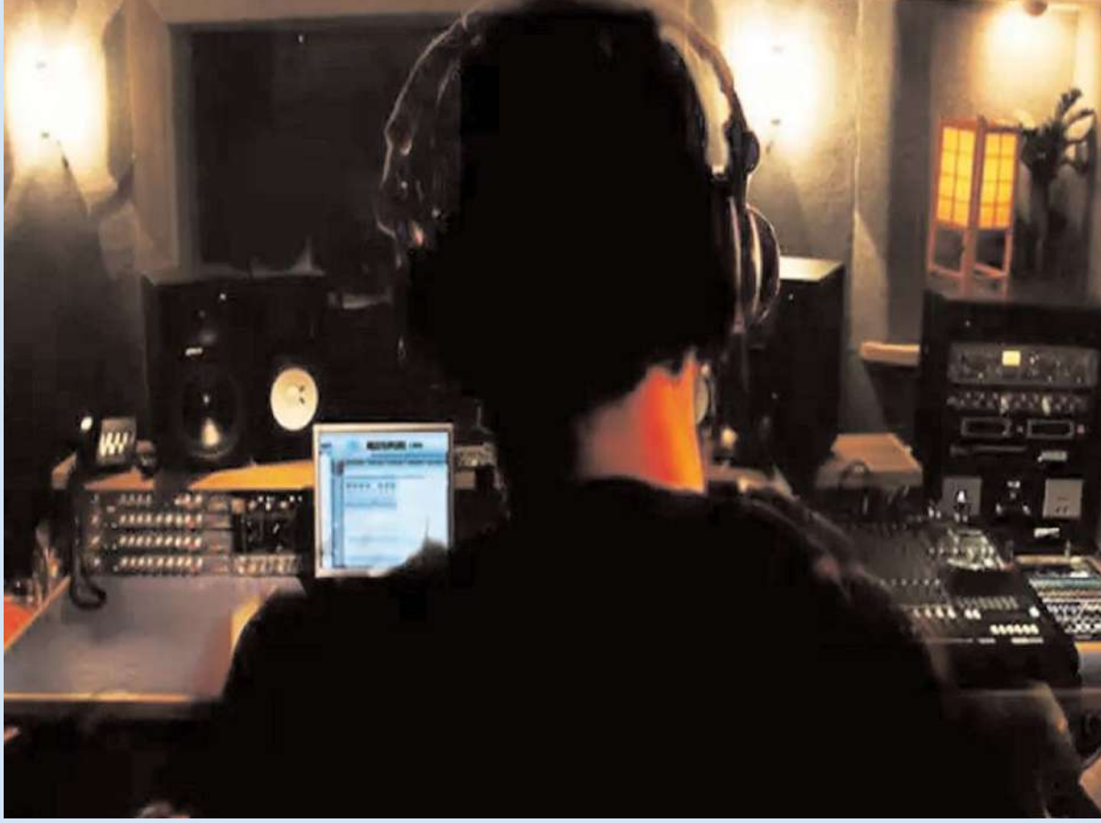
ఉమ్మడి ఆంధ్రప్రదేశ్ లో కూడా జరగలేదు.

విపక్ష బిల్లులను తాను చేసిన తప్పలను కప్పిపుచ్చుకునేందుకు నానా తంటాలు పడుతోంది. గతంలో చేసిన తప్పలు ఒక్కొక్కటిగా బయటపడడంతో ఎదురుదాడి మంత్రం ప్రయోగిస్తోంది. తామంతా సుదృఢులను అన్నట్లుగా కెసిఆర్, కెటిఆర్, హరీష్ రావులు పాడిందే పాటగా పాడుతున్నారు. ఓ వైపు దర్బారు సందర్భాలు ఒక్కో అవినీతి పుట్టను తప్పి పెడుతున్నారు. ఫోన్ ట్యాపింగ్, ప్రాజెక్ట్ కుంభకోణాలు, అవినీతి, ధరణి ఇలా ఒక్కటిమీటి అనేక రకాలుగా అవినీతి చెదను గుర్తించారు. పదేళ్లలో వందేళ్ల విధ్వంసం జరిగిందని సిఎం రేవంత్ కూడా పత్రికా ముఖంగా ప్రకటిస్తున్నారు. అయినా సిగ్గు ఎగ్గు లేకుండా ఎదురుదాడి మంత్రం అన్నట్లుగా బిల్లులను నేతల వ్యవహారం ఉంది. నిజానికి ఇంతటి విధ్వంసం