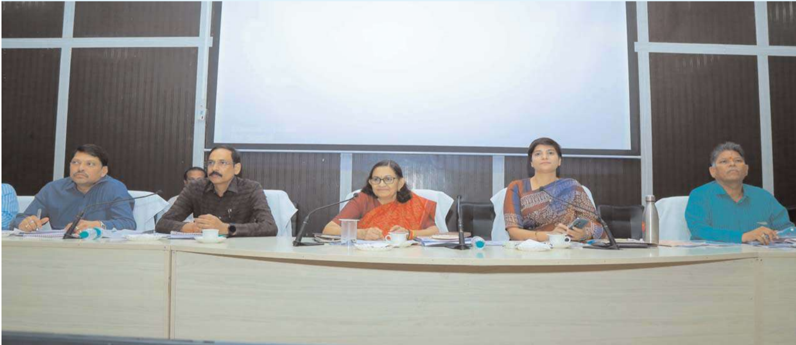
నల్గొండ, అక్షిత ప్రతినిధి :