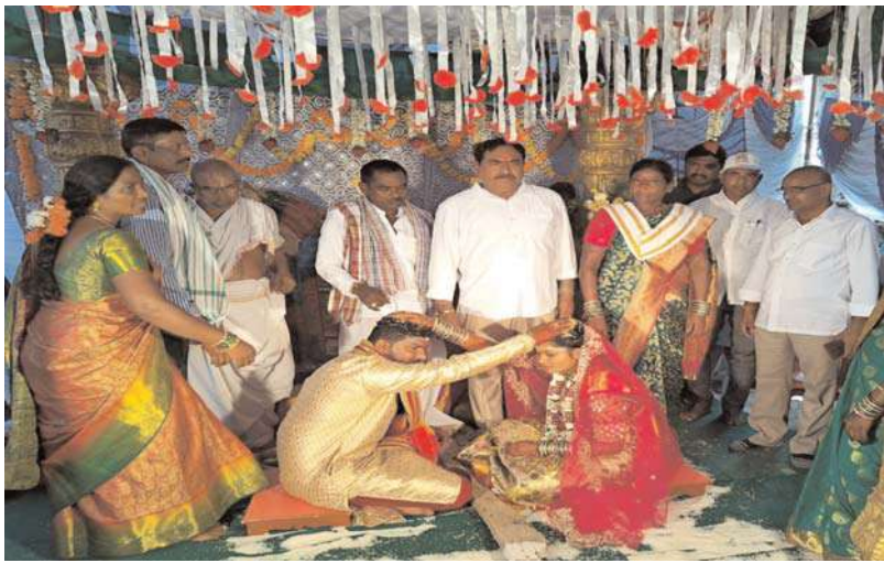
రాయపర్తి అక్షయ ప్రతినిధి