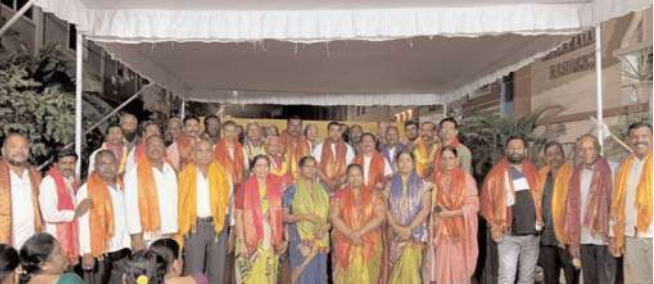
శేరిలింగంపల్లి అక్షిత ప్రతినిధి..