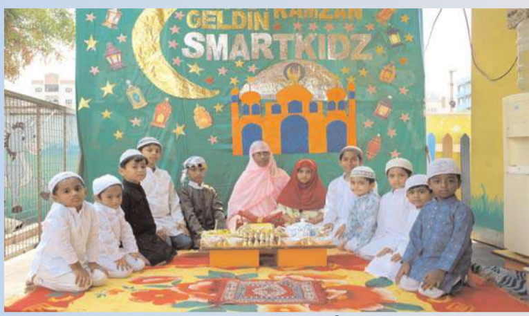
ఖమ్మం/అక్షిత బ్యూరో :

ఖమ్మం నగరం స్మార్ట్ కిడ్స్ పాఠశాలలో శనివారం రంజాన్ సంబురాలను ఘనంగా నిర్వహించారు.పవిత్ర రంజాన్ మాసం పురస్కరించుకొని పాఠశాల చిన్నారులు మతసామరస్యాన్ని చాటుతూ ఈ వేడుకల్లో పాల్గొన్నారు. విద్యార్థులు పవిత్ర ఖురాన్ చదువుతూ నమాజులో పాల్గొన్నారు.నమాజ్ అనంతరం ఒకరినొకరు అలింగనం చేసుకొని రంజాన్ మాస శుభాకాంక్షలు తెలియజేశారు. సేమ్యూలు ఒకరికొకరు పంచుకుంటూ తమ