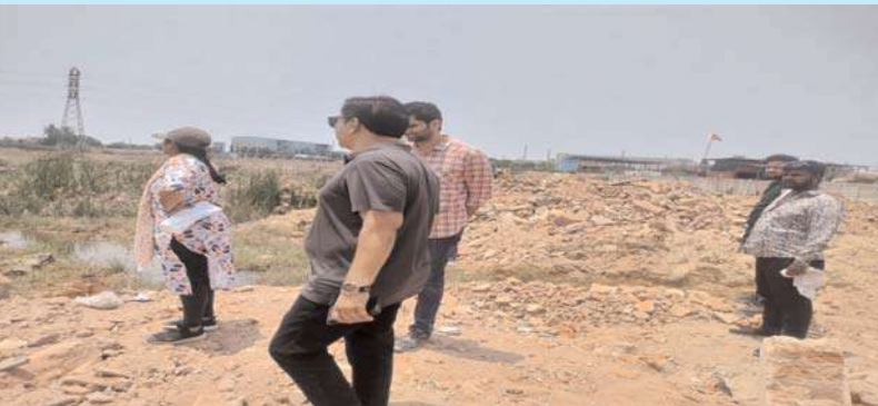
షెడ్యూల్, అక్షిత బ్యారో :