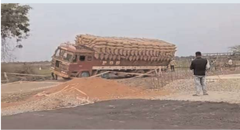
చేర్యాల,ఏప్రిల్ 16 అక్షయ ప్రతినిధి:

జనగామ నుండి చేర్యాల మండల వరదీ మీదుగా దుద్దెడ క్రాస్ రోడ్డు వరకు ఇటీవల నాలుగు లైన్ల రోడ్డు సాంక్షన్ ఐ సుమారు 8 నెలలు అవుతున్న ఈ రోడ్డు పనులు పూర్తి కావడం ప్రయాణికులు, వాహనదారులు నానా ఇబ్బందులకు గురవుతున్నారు. త్వరగా కల్వర్టు పనులు పూర్తి కాకపోవడంతో భారీ వాహనాలకు ఇబ్బందులకు గురవుతున్నారు. మంగళవారం చేర్యాల మీదుగా సిద్దిపేట కు వెళ్లే వరి ధాన్య లోడి లారీ తాడూరు క్రాస్ రోడ్ వద్ద కల్వర్టు పనులు నిర్మాణం అవుతున్నందున, తాత్కాలిక రహదారి పక్కన మల్లించిన దారిపై లోడ్ లారీ వెళుతూ దిగబడి నందున ప్రయాణికులు వాహనదారులు నానా ఇబ్బందులకు గురైనారు. ఈ సందర్భంగా ప్రయాణికులు మాట్లాడుతూ రోడ్డు పనులను నత్త నడక నా సాగకుండా త్వరగా పూర్తయ్యే విధంగా సంబంధిత అధికారులు చర్యలు చేపట్టాలని అన్నారు. వేసవికాలంలోనే ఇలా పరిస్థితి ఉంటే వచ్చే వర్షాకాలంలో ఇంకా ఎన్ని ఇబ్బందులకు గురి కావాల్సి వస్తుందోనని ఆందోళనకు గురవుతున్నారు.