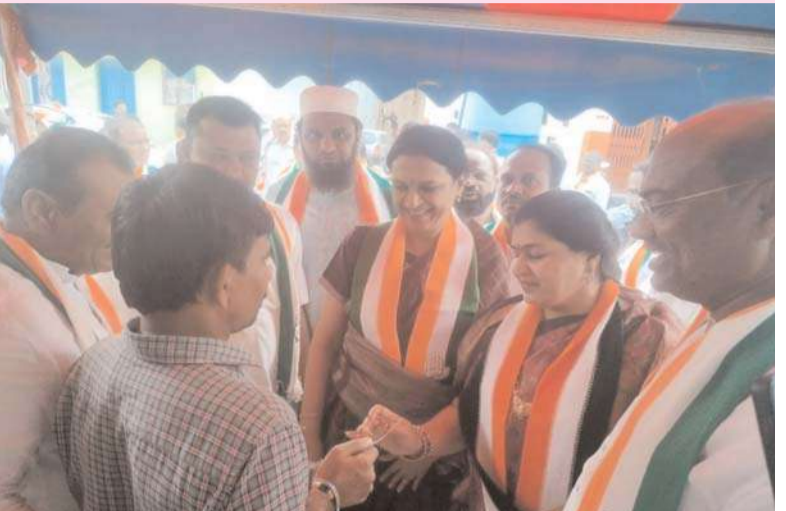
శేరిలింగంపల్లి అక్షత ప్రతినిధి..