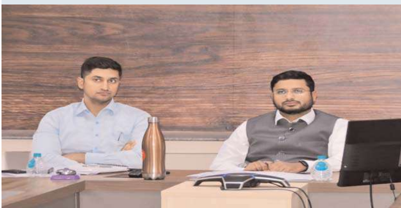
జనగామ, అక్షయ ప్రతినిధి: