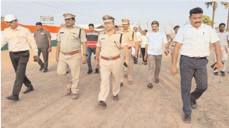
వరంగల్, అక్షయ బ్యూరో:

24వ తేదీ మధ్యాహ్నం 3:00గంటలకు మడికొండ ఈనాడు ఆఫీస్ ఎదురుగా నిర్వహించనున్న వరంగల్ పార్లమెంట్ నియోజకవర్గ కాంగ్రెస్ పార్టీ భారీ బహిరంగ సభ ఏర్పాటు చేయడంతో పాటు ఈ సభకు ముఖ్యమంత్రి హాజరువుతుందంటే ఈ సభ పోలీస్ బందోబస్ట్ ఏర్పాటు ను వరంగల్ పోలీస్ కమిషనర్ అంబర్ కిషోర్ రూూ అధికారులతో పోలీస్ అధికారులతో పరిశీలించారు. సభ నిర్వహించబడే ప్రాంగణంలో భారీకేంద్ర ఏర్పాటు, హెలిప్యాడ్, పార్కింగ్ స్థలాలు, ట్రాఫిక్ మళ్లింపు, ముఖ్యమంత్రికి కల్పించాల్సిన భద్రత ఏర్పాటు తో పాటు సభకు ప్రజలు చేరుకునే మార్గాలపై పోలీస్ కమిషనర్ పోలీస్ అధికారులతో క్షేత్ర స్థాయిలో సమీక్షా చేయడంతో పాటు అధికారులు బందోబస్ట్ ఏర్పాటుపై పలుసూచనలు చేశారు.