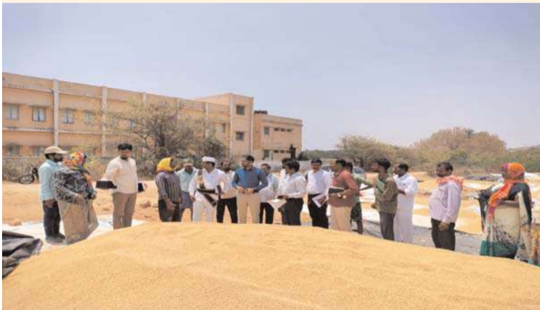
జనగామ, అక్షిత ప్రతినిధి: