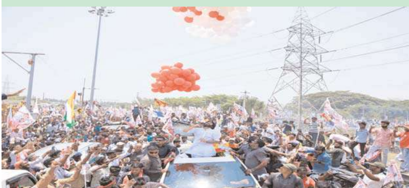
కాకినాడ, అక్షిత ప్రతినిధి :