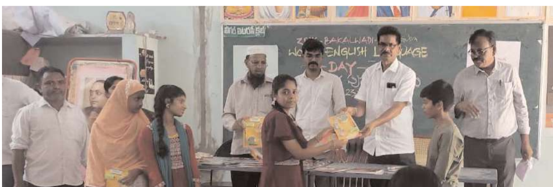
మిర్యాలగూడ, అక్షిత ప్రతినిధి :

ప్రపంచ వుస్తక దినోత్సవం, ఆంగ్ల భాషా దినోత్సవ సందర్భంగా జిల్లా పరిషత్ ఉన్నత పాఠశాల బకాల్యాడ గ్రంథాలయంలో ఇంగ్లీషు లాంగ్వేజ్ డిపార్ట్మెంట్ ఆధ్వర్యంలో ఆంగ్లభాష,