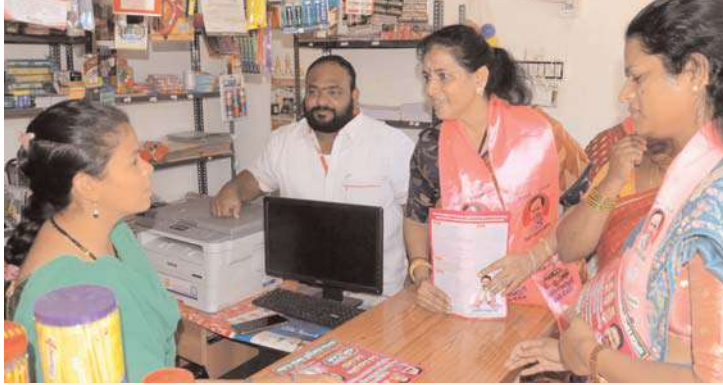
ఎల్వీనగర్, అక్షత ప్రతినది