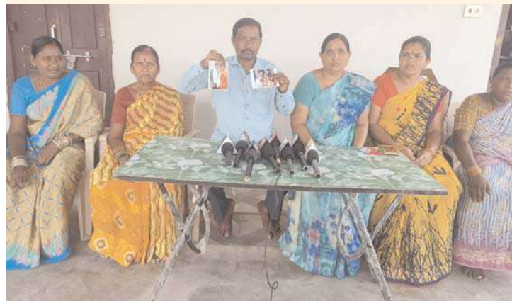
వరంగల్, అక్షత బ్యూరో: