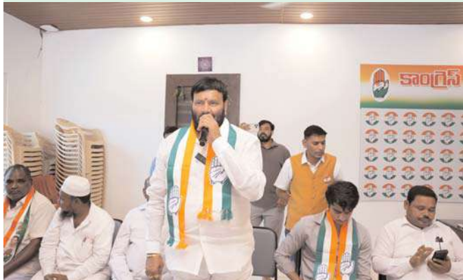
మేధుల్, అక్షిత బ్యూరో :