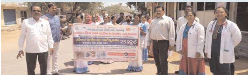
రంగా రెడ్డి అక్షయ ప్రతినిధి :