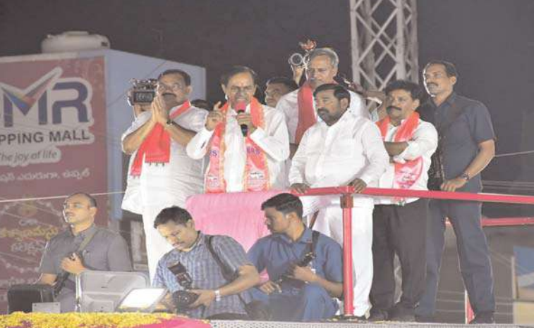
యాదాద్రి భువనగిరి, అక్షయ ప్రతినిధి :

సబ్ కా సాత్, సబ్ కా వికాస్ అభివృద్ధి ఏది..? దేవుడి పేరుతో ఓట్లు !సిగ్గు సిగ్గు ఒట్టులతో కాంగ్రెస్ తీరు