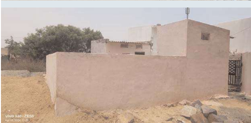
మేధుల్, అక్షయ జ్యూరీ:

దుండగల్ గండి మైసమ్మ మండల పరిధిలో ప్రభుత్వ స్థలాలు కాపాడటంలో రెవెన్యూ అధికారులు విఫలమవుతున్నారని బలంగా విమర్శలు వినిపిస్తున్నాయని చేతులు కాలాక ఆకులు పట్టుకట్టుగా సామెత గా ఉంది నీ సాయి పూజ కాలనీ డాక్టర్ బస్టి రాజు బస్టిలో జోరుగా ప్రభుత్వ స్థలాలలో కబ్జాలు పట్టవగలే స్టేడియం కు వెళ్ళే దారిలో 120/119 సర్వేనెంబర్ ఏకంగా ప్రభుత్వ సూచిక బోర్డు సాక్షాత్తు ఎదురుగానే ఏకంగా కాంపౌండ్ వాల్ రూము కట్టి పెయింట్లింగ్ కూడా చేస్తున్నారని అని స్థానికులు ఫిర్యాదులు అందించిన ఆరణ వివరణ కోసం మీడియా ఫోన్ చేయగా ఫోను స్పందించరు అంటే అధికారుల కబ్జాలతో మొలకత్. అయినట్టేనా.? ఇదే విషయంపై తాసిల్దార్ కు వివరించగా చర్యలు చేపడతాం అన్నారు. కానీ నేటికీ చర్యలు చేపట్టకపోవడం గమనార్హం..? ఏమిటని స్థానికులు బలంగా వినిపిస్తున్నారు ఒక ప్రక్కన ఎన్నికల విధుల్లో అధికారులు ఉండగా ఇదే అదనంగా భావించిన బుకబ్బాదారులు ప్రభుత్వ స్థలాలనే టార్గెట్ గా చేసుకొని 59 జీవో ఉండంటూ నిర్మాణాలు చేపడుతున్నారు. అసలే గత ప్రభుత్వ లో అవకతవకలు జరిగాయని దీనిపై కాంగ్రెస్ పార్టీ ప్రభుత్వం ఏర్పడ్డ తర్వాత నయానా మీడియాతో ముఖ్యమంత్రి రేవంత్ రెడ్డి నిలుపుదల చేస్తూ తర్వాత పరిశీలన చేసి విచరిస్తామని తెలిపారు.అయినా ఆగిన ఆక్రమ నిర్మాణాలు గండిమైసమ్మ మండల పరిధిలో వీటిపై పరిశీలన చేసి చర్యలు చేపట్టాలని స్థానికులు కోరుతున్నారు..