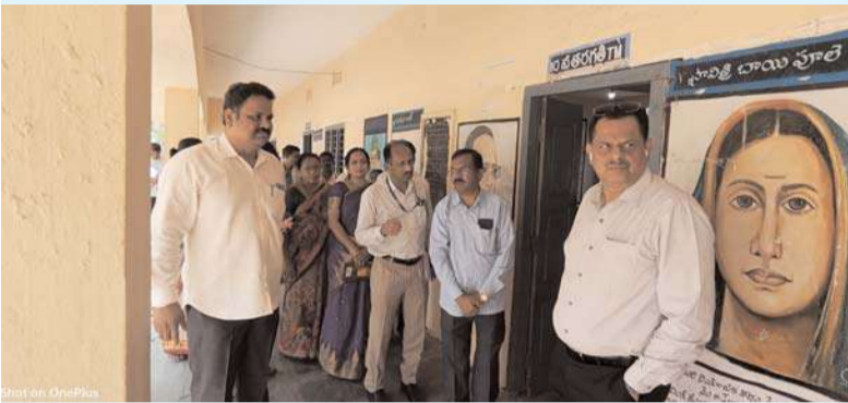
మిర్యాలగూడ, అక్షత ప్రతినిధి: