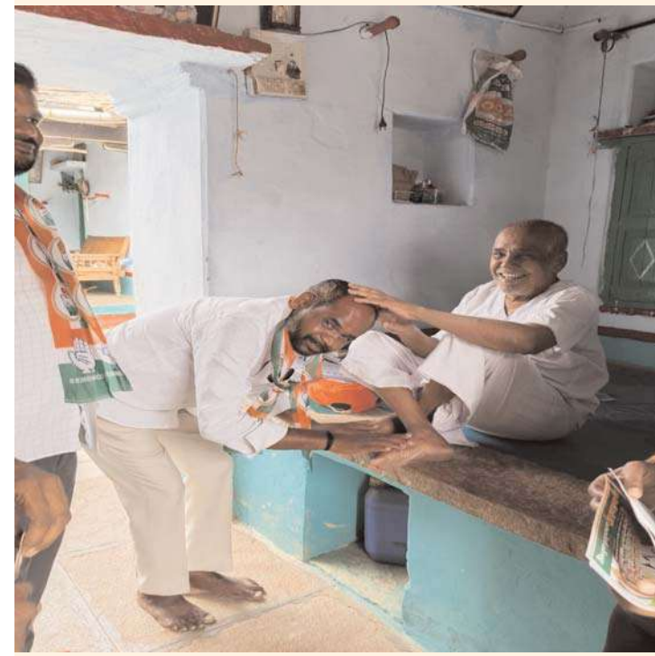
కొడంగల్, అక్షయ ప్రతినిధి :