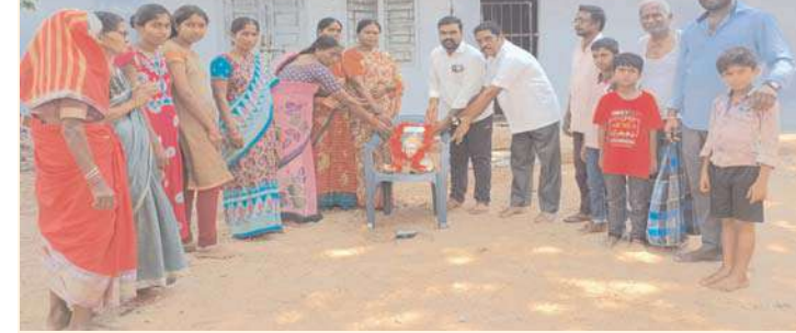
నకిరేకల్ అక్షయ ప్రతినిధి