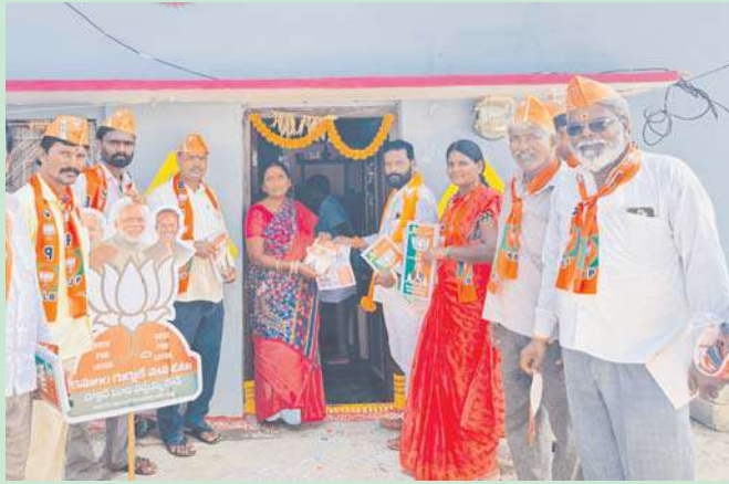
నకిరేకల్ అక్షయ ప్రతినిధి