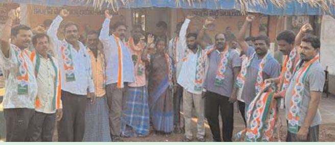
కాద్యాయి, అక్షయ ప్రతినిధి