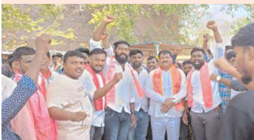
వరంగల్, అక్షయ బూత్:

భారీ మెజారిటీతో బీఆర్ఎస్ అభ్యర్థిని గెలిపించడానికి సిద్ధమైన వరంగల్ ప్రజలు... మాజీ ఎమ్మెల్యే సరేందర్..