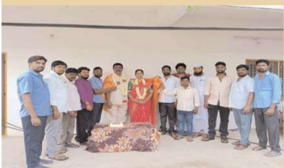
మాడుగుల పల్లి అక్షిత ప్రతినిధి :