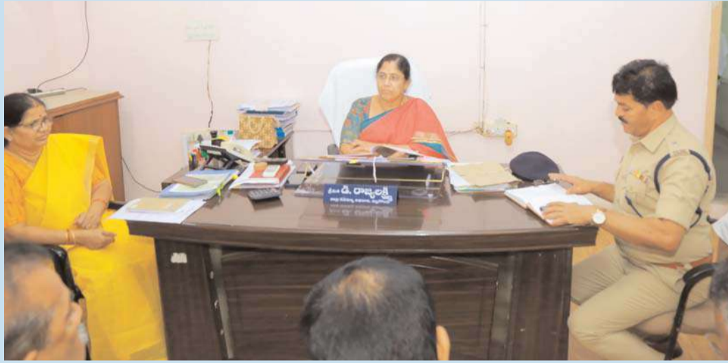
నల్గొండ, అక్షిత ప్రతినిధి :