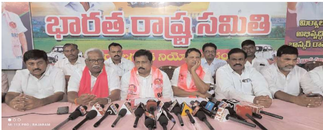
మిర్యాలగూడ, అక్షిత ప్రతినిధి :