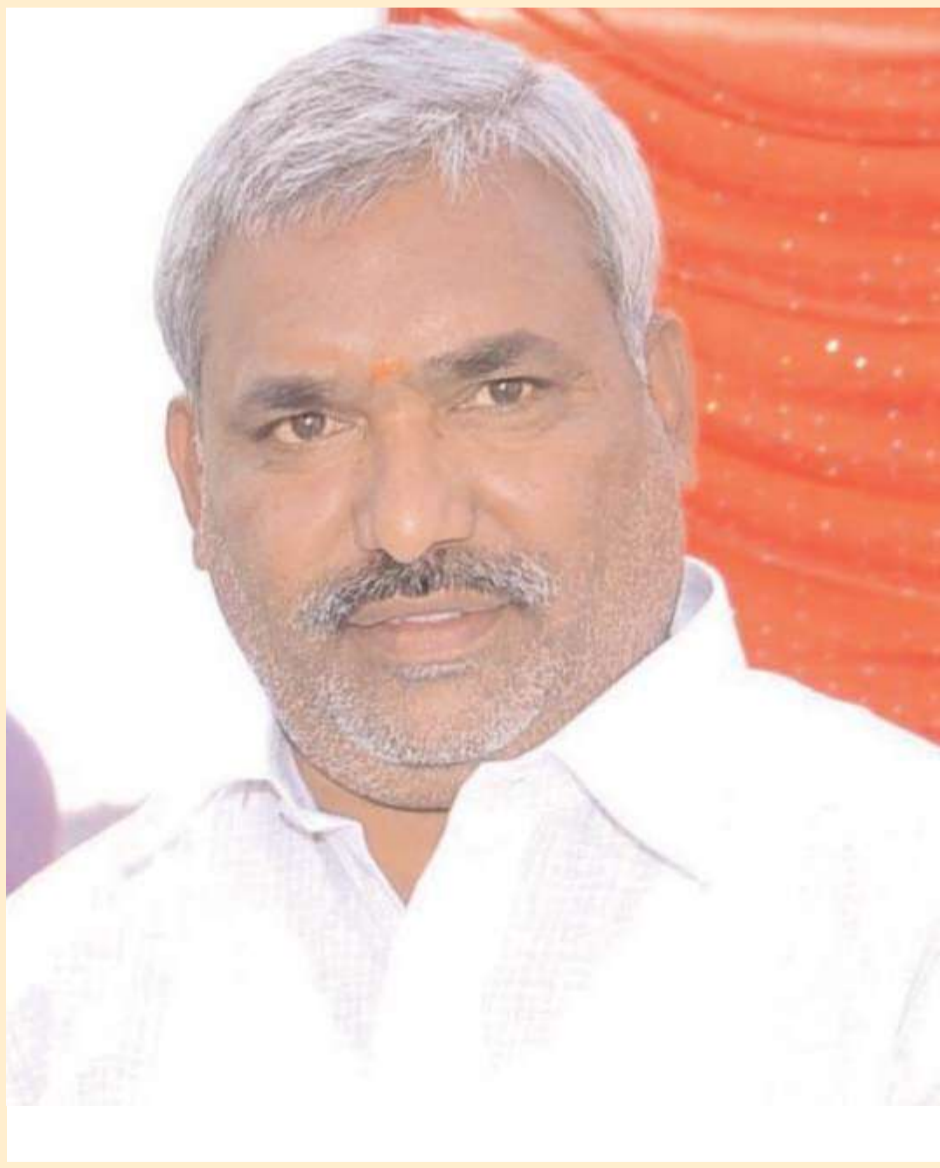
రాజకీయ మార్పు కు నాంది పలకాలని ఆశిద్దాం.