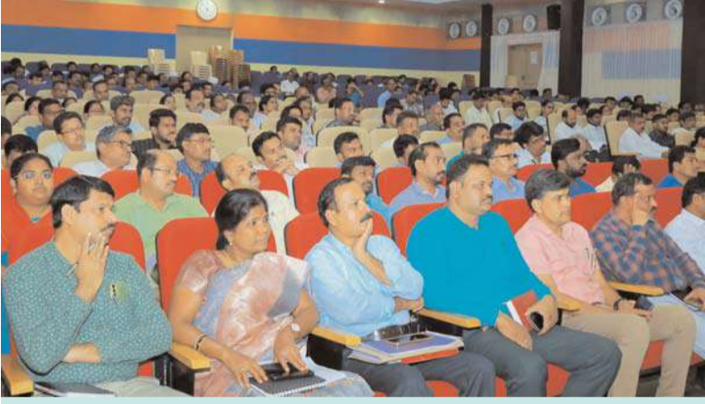
నల్గొండ, అక్షిత ప్రతినిధి :