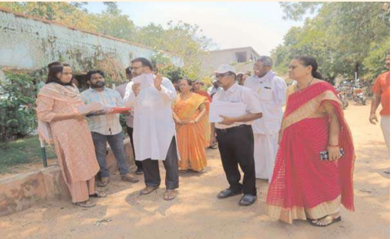
వరంగల్, అక్షయ బ్యూరో: