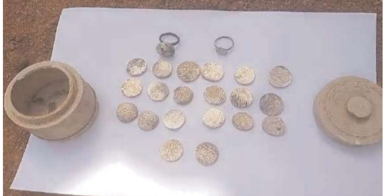
చేర్యాల(మద్దూరు)మే 30 అక్షిణి ప్రతినిధి: