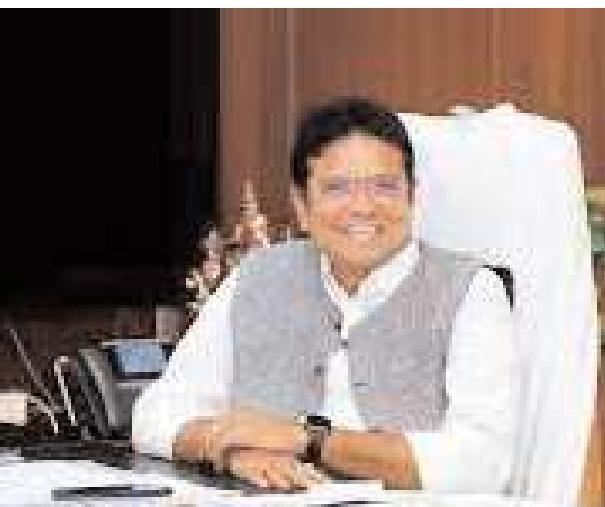
వ్యవసాయ అనుబంధ పరిశ్రమలకు ప్రాధాన్యమిస్తామని శ్రీధర్ బాబు వివరించారు.

హైదరాబాద్, అక్షిత ప్రతినది : తెలంగాణ రాష్ట్రాభివృద్ధిలో మహిళా పారిశ్రామికవేత్తల పాత్ర ఎంతో కీలకమని మంత్రి శ్రీధర్ బాబు అన్నారు. హైదరాబాద్ లో ఫిక్సీ లేడీస్ ఆర్గనైజేషన్ ఆధ్వర్యంలో 'సూక్ష్మ, చిన్న, మధ్యతరహా పరిశ్రమలు - సమీకృత అభివృద్ధి' అంశంపై నిర్వహించిన సదస్సులో ఆయన పాల్గొని మాట్లాడారు. మహిళలకు వ్యాపారాల్లో తోడ్పాటునందిస్తామని తెలిపారు. వాళ్లు పారిశ్రామికవేత్తలుగా ఎదగడానికి ప్రభుత్వం తగిన సహకారం అందిస్తుందన్నారు. ప్రభుత్వం నూతన పారిశ్రామిక విధానాన్ని రూపొందిస్తోందని శ్రీధర్ బాబు చెప్పారు. అందులో మహిళా పారిశ్రామికవేత్తలకు తగిన ప్రాధాన్యం ఇస్తామన్నారు. పారిశ్రామిక విధానంలో భాగంగా రాష్ట్రాన్ని మూడు జోన్లుగా విభజించేస్తామన్నారు. ఓఆర్ఆర్ లోపల ఐటీ కంపెనీలకు ప్రాధాన్యం ఉంటుందని చెప్పారు. రీజినల్ రింగ్ రోడ్ల పరిధిలో పరిశ్రమలు, మిగతా ప్రాంతాల్లో