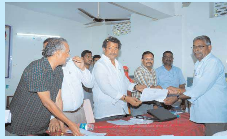
మిర్యాలగూడ, అక్షిత ప్రతినిధి :