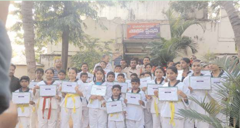
యాదాద్రి భువనగిరి అక్షిత ప్రతినిధి :