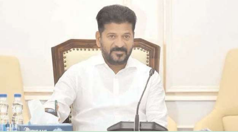
వరంగల్, అక్షిత బ్యూరో:

ఈ నెల 28న వరంగల్ నగరంలో సీఎం రేవంత్ రెడ్డి పర్యటించనున్నారు. నగరం అభివృద్ధిపై ముఖ్యమంత్రి దృష్టి సారించనున్నారు. అభివృద్ధి పనులపై ఈనెల 28న హనుమకొండ కలెక్టరేట్లో సీఎం సమీక్ష సమావేశం నిర్వహించనున్నారు. కూడా పరిధిలో చేపట్టబోయే అండర్ డ్రైనేజీ పనులతో పాటు ఎన్ఫోర్స్ ప్రవారంలో ఇచ్చిన హామీలను నెరవేర్చేందుకు ప్రజాప్రతినిధులతో పాటు అధికారులతో ఉదయం నుంచి సాయంత్రం వరకు వరంగల్లోనే సమీక్ష సమావేశం నిర్వహించనున్నారు.