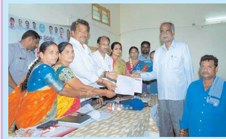
మిర్యాలగూడ, అక్షిత ప్రతినిధి :