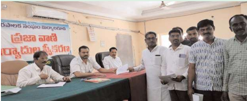
మిర్యాలగూడ, అక్షిత ప్రతినిధి :