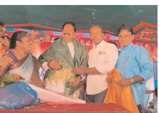
శేరిలింగంపల్లి అక్షయ ప్రతినిధి..