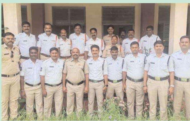
తరగతుల్లో పోలీస్ అధికారులకు కొత్త చట్టాలపై భారతీయ

వచ్చే నెల జూలై 1 నుండి అమలు కానున్న నూతన చట్టాలపై పోలీస్ అధికారులు, సిబ్బందికి అవగాహన కల్పించుకోవడం వరంగల్ పోలీస్ కమిషనరేట్ అంబర్ కిషోర్ రూపొందించిన మేరకు వరంగల్ పోలీస్ కమిషనరేట్ పరిధిలో కొత్త చట్టాలపై అవగాహన కోసం ప్రత్యేక శిక్షణ తరగతులు కొనసాగుతున్నాయి. ఇందులో భాగంగా సెంట్రల్ జోన్ పరిధిలోని శాంతి భద్రతల విభాగానికి చెందిన పోలీస్ అధికారులతో పాటు ఇతర వివిధ విభాగాలయిన ట్రాఫిక్, సి.సి.సి. సి.సి.ఆర్.సి, సైబర్, ట్రాన్స్, ఐ.టి.కోర్, సైబర్ క్రైం విభాగాలకు చెందిన పోలీస్ అధికారులకు స్థానిక ఎల్. బి. కళాశాల లో ఏర్పాటు చేసిన ఈ శిక్షణ తరగతులకు పోలీస్ అధికారులు, సిబ్బంది విదతల వారిగా హాజరువుతున్నారు. రాష్ట్ర పోలీస్ శిక్షణ కేంద్రంలో ముందుగా శిక్షణ పొందిన అధికారుల ఆధ్వర్యంలో నిర్వహిస్తున్న ఈ శిక్షణ