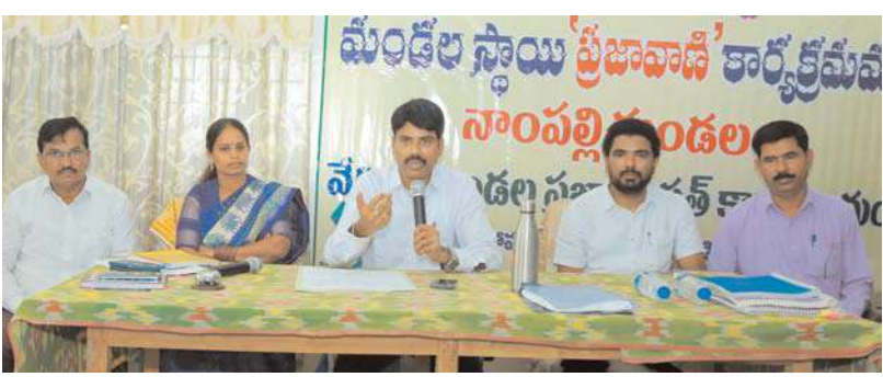
నల్గొండ, అక్షిత ప్రతినిధి :

ప్రజా సమస్యలను గ్రామస్థాయిలోనే పరిష్కరించాలన్న ఉద్దేశంతో మండల ప్రజావాణి కార్యక్రమాన్ని చేపట్టినట్లు జిల్లా కలెక్టర్ సి. నారాయణరెడ్డి తెలిపారు. ప్రతి సోమవారం నిర్వహించే ప్రజావాణి కార్యక్రమంలో భాగంగా మండల స్థాయిలో కార్యక్రమాన్ని పెద్ద ఎత్తున నిర్వహించాలని ఇదివరకే జిల్లా కలెక్టర్ నిర్ణయించిన విషయం తెలిసిందే. ఇందులో భాగంగానే మొదటి సోమవారం ఆయన నల్గొండ జిల్లా వింతపల్లి, నాంపల్లి మండలాల లో నిర్వహించిన ప్రజావాణి కార్యక్రమానికి హాజరయ్యారు. ప్రజావాణి కార్యక్రమం జరిగే తీరు తెలుసుకోవడమే కాకుండా మండల స్థాయి అధికారులు, గ్రామపంచాయతీ కార్యదర్శులతో ప్రజావాణి కార్యక్రమం పై మాట్లాడి సూచనలు, సలహాలు ఇచ్చారు. అంతేకాక జిల్లా కలెక్టర్ స్వయంగా ప్రజల వద్ద నుండి ఫిర్యాదులను స్వీకరించారు. జిల్లా కలెక్టర్ మాట్లాడుతూ ప్రజా సమస్యల సత్వర పరిష్కారానికి మండల ప్రజావాణి నిర్వహిస్తున్నా మన్నారు. ఎక్కడి సమస్యలకు అక్కడే పరిష్కారం దొరకాలని, ప్రత్యేకించి గ్రామ స్థాయిలోనే సమస్యలు పరిష్కారం కావాలన్న ఉద్దేశంతో మండల స్థాయి ప్రజావాణి చేపట్టామన్నారు. ప్రతి సోమవారం రెగ్యులర్ గా ప్రజావాణి నిర్వహించాలని, ప్రతి ఫిర్యాదును క్షుణ్ణంగా చదవాలని, పరిష్కారం అయ్యేవి వెంటనే పరిష్కరించాలని, లేకుంటే