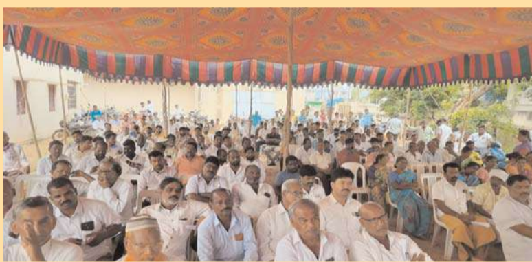
దెబ్బతీసే కాలుష్య పరిశ్రమకు వ్యతిరేకంగా ముక్తకంఠంగా పోరాడి భవిష్యత్తు తరాలను కాపాడుకోవాలని పిలుపునిచ్చారు.