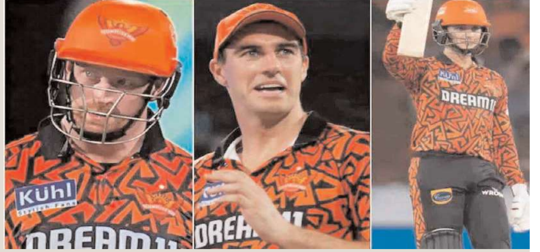
శర్మలతో పాటు హెన్రీ క్లాన్సన్లను ఆరెంజ్ జట్టు రిటైర్ చేసుకోనుంది.

ఇండియన్ ప్రీమియర్ లీగ్ 17వ సీజన్ రన్సర్వ్ సన్రైజర్స్ హైదరాబాద్ మో వేలం కోసం సిద్ధమవుతోంది. రైల్వే టు మ్యాచ్ తో కలిపి ఆరుగురిని అట్టిపెట్టుకోవడం ద్వారా బీసీసీబి అవకాశం ఇవ్వడంతో ఎవరిని వదిలేయాలి? అనేదానిపై కనరత్తు మొదలైంది. రిటైర్ చేసుకొనే ఆటగాళ్లపై హైదరాబాద్ యాజమాన్యం చాలా స్పష్టతతో ఉన్నట్లు సమాచారం. అంతేకాదు ఈసారి రికార్డు ధరకు ఎవరిని రిటైర్ చేసుకోవాలో కూడా ప్రాంచైజీ ఓ నిర్ణయానికి వచ్చిందట. అలాగే.. ఇంకెవరు జట్టును పైసల్ చేర్చిన కెప్టెన్ ప్యాల్ కమిస్న్ అనుకుంటే మీరు పొరబడినట్టే. గత రెండు సీజన్లలో అదరగొట్టిన చిన్నపిడుగు హెన్రీ క్లాన్సన్ కు రూ. 23 కోట్లు చెల్లించేందుకు హైదరాబాద్ యాజమాన్యం సిద్ధ ముతోంది. తదిహానో సీజన్లో అద్భుతంగా రాణించిన ఆటగాళ్లను హైదరాబాద్ ప్రాంచైజీ అట్టిపెట్టుకోనుంది. ముఖ్యంగా మిసీ వేలంలో రికార్డు ధర పలికి జట్టు పగ్గాలు చేపట్టిన కమిస్న్, విద్యుంశక ఓపెనర్లు ట్రావిస్ హెడ్, అజిష్