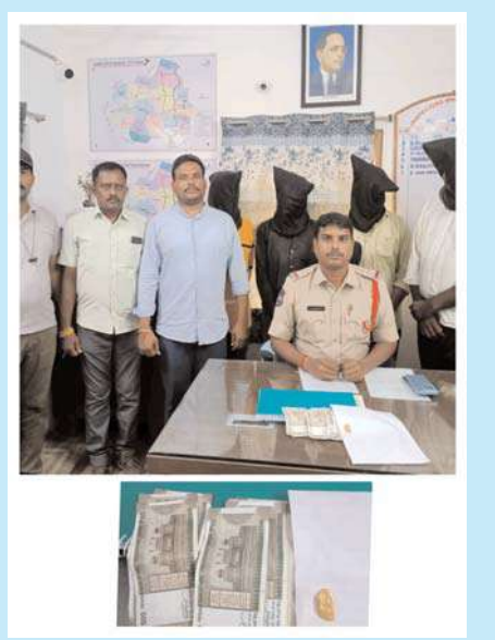
కమలాపూర్ అక్టోబర్ 17, (అక్షిత )