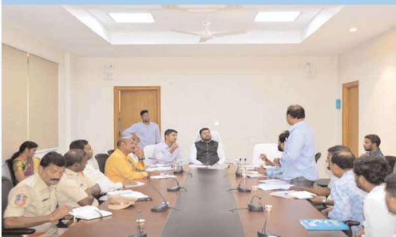
జనగామ, అక్షత ప్రతినిధి:

ప్రతి ఒక్క శాతానికి ఒక శాతం చొప్పున ధర తగ్గుతుందని...రైతులు ఈ విషయాన్ని గమనించి సరైన తేమ శాతంతో పత్తిని తీసుకుని వచ్చి మద్దతు ధర పొందాలని కోరారు. ఈసారి వ్యవసాయ మార్కెటింగ్ శాఖ ద్వారా ఏర్పాటు చేసిన వాట్సాప్ చాట్ సేవలను సద్వినియోగం చేసుకోవాలని తెలియజేశారు. 88972 81111 నెంబర్ ను మొబైల్లో సేవ్ చేసుకొని %వృత్తి% అని టైప్ చేయడం ద్వారా కాటన్ అమ్మకం, అర్హత, తక్కువ వీవరాలు, చెల్లింపు స్థితి, సీసీఐ సెంటర్లో వేచి ఉండే సమయం వంటి వివరాలు తెలుసుకోవచ్చన్నారు. సీసీఐకి పత్తి అమ్ముకోవాలంటే ఆధార్ ప్రామాణికత అనేది తప్పనిసరి అని...ఆధార్ ప్రామాణికత ఉండే విధంగా ముందుగానే సరిచూసుకొని రావాలన్నారు. పత్తి కొనుగోలు చెల్లింపులను ఆధార్లో అనుసంధానం అయిన బ్యాంకు ఖాతాలో మాత్రమే జమ చేయడం జరుగుతుందని...రైతులు తమ ఆధార్కు అనుసంధానమైంటుంటే బ్యాంకు ఖాతా యాక్టివ్గా ఉండేలా చూసుకోవాలన్నారు.