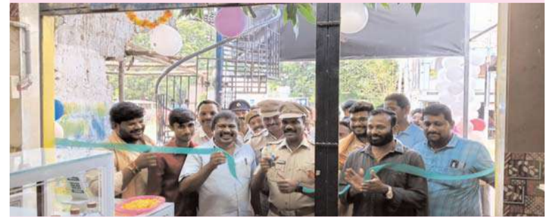
గరిడేపల్లి అక్షిత ప్రతినిధి