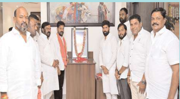
హైదరాబాద్, అక్షిత ప్రతినిధి :