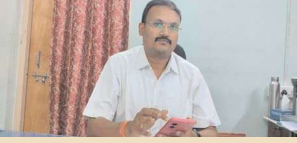
మిర్యాలగూడ, అక్షిత ప్రతినిధి :