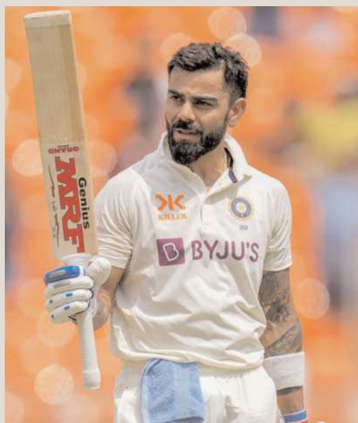
ఈ జాబితాలో సచిన్ టెండూల్కర్ 264 ఫిఫ్టీ ప్రస్ సోద్రతో టాప్ లో కొనసాగుతున్నాడు. నెంబర్-3లో విరాట్ కోహ్లికి ఇదే

టీమిండియా యువ బ్యాటర్ సర్కాజ్ ఖాన్ స్టన్నింగ్ ఫాట్తో ఆకట్టుకున్నాడు. న్యూజిలాండ్తో జరిగిన టెస్టులో 9 వేల పరుగుల మైలురాయిని పూర్తి చేసుకున్నాడు. ఈ ఘనతను అందుకున్న భారత నాలుగో బ్యాటర్గా చరిత్రకెక్కాడు. న్యూజిలాండ్తో జరిగిన టెస్టులో 9 వేల పరుగుల మైలురాయిని పూర్తి చేసుకున్నాడు. ఈ ఘనతను అందుకున్న భారత నాలుగో బ్యాటర్గా చరిత్రకెక్కాడు. న్యూజిలాండ్తో జరిగిన టెస్టులో 9 వేల పరుగుల మైలురాయిని పూర్తి చేసుకున్నాడు. ఈ ఘనతను అందుకున్న భారత నాలుగో బ్యాటర్గా చరిత్రకెక్కాడు.