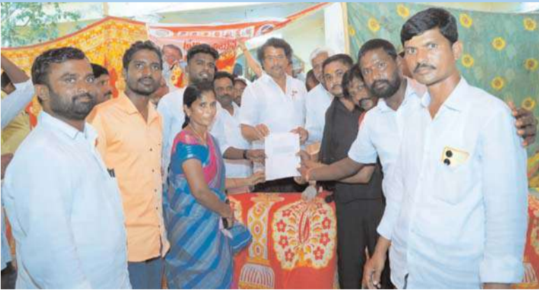
వేములపల్లి, అక్షితన్యూస్ :