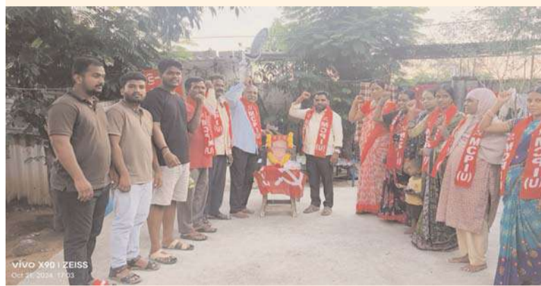
శేరిలింగంపల్లి అక్షయ ప్రతినిధి..