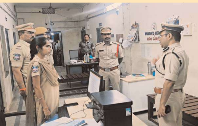
వరంగల్, అక్షిత బ్యూరో: