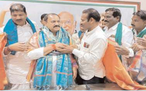
ఖమ్మం