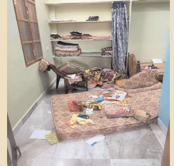
సూర్యాపేట అక్షిత బ్యూరో

సూర్యాపేట జిల్లా కేంద్రంలో 60 వేల రూపాయల శ్రీరామ నగర్ ఐదు తులాల బంగారం, మరో ఇంటి లో రూ.6 వేల నగదు స్వాహా ఒక రోజు మూడు ఇంట్లో దొంగతనం జరిగింది. సూర్యాపేట జిల్లా బాలాజీ నగర్ లో ఒక రోజు మూడు ఇంట్లో దొంగతనం జరిగింది. కిరాబం షాపులో మరో రెండు ఇంట్లో కోరి జరిగింది. దొంగలు ఇంటి తాళాలు, బీరువా తాళాలు పగులగొట్టి రెండు తులాల బంగారం ఆభరణాలు, రూ.60 వేల నగదు అవసరించుకుపోయారు. కుటుంబ సభ్యులు ఇంటికి చేరుకోవడంతో అనలు విషయం తెలిసింది. దీంతో పోలీసులు పులనాస్థలంలో పరిశీలించడం జరిగింది దొంగతనం జరగడంతో ఒక్కసారిగా కాలనీవాసులు ఉలిక్కిపడుతున్నారు. సంధర్భంగా బాలాజీ నగర్ శ్రీరామ్ నగర్ ప్రజలు జాగ్రత్తగా ఉండాలని పోలీసులు సూచిస్తున్నారు. విలువైన బంగారం నగలు, నగదు ఇంట్లో కాకుండా బ్యాంక్ లాకర్ లో ఏర్పాటు చేసుకోవాలని సూచిస్తున్నారు.