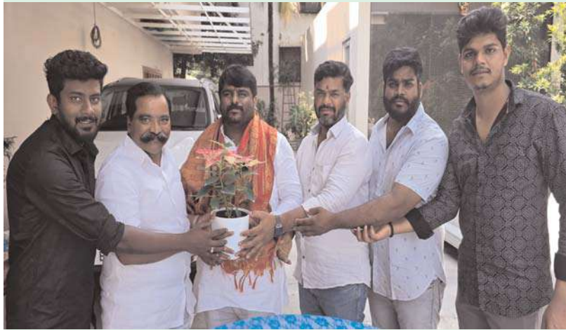
శేరిలింగంపల్లి అక్షిత ప్రతినిధి..