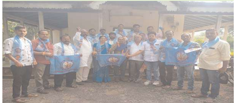
నర్సంపేట, అక్షత ప్రతినిధి :