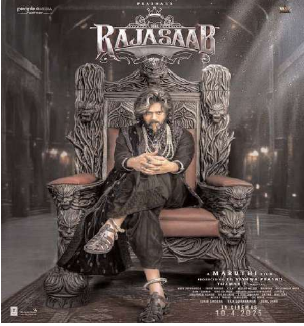
అంచనాలకు తగ్గట్టే తాజాగా విడుదలైన వీడియో ఆకట్టుకుంటోంది. పాస్ ఇండియా స్టాయిల్ ఈ చిత్రం ఏచ్చే ఏడాది ఏప్రిల్ 10న విడుదల కానుంది.

ప్రభాస్ హీరోగా దర్శకుడు మారుతి తెరకెక్కిస్తున్న చిత్రం 'ది రాజాసాబ్' మాజీ మాజీ మోహన్, నిధి అగర్వాల్, రిద్ది కుమార్ హీరోయిన్లుగా విడుదలకు సిద్ధం అవుతోంది. ప్రభాస్ పుట్టినరోజు సందర్భంగా టీమ్ సర్ ప్రైజ్ ఇచ్చింది. స్పెషల్ వీడియోతో మోషన్ పిక్చర్ను విడుదల చేసింది. అందులో ప్రభాస్ సంచలనం మీద ఓ చేతిలో సిగారెతో రాజా లుక్లో కనిపించి అభిమానుల్లో జోష్ నింపారు. హారర్, కామెడీ నేపథ్యంతో ఈ సినిమా రూపొందుతోంది. ఈ శ్రేణి ప్రాజెక్టు అప్ డేట్స్ కోసం అభిమానులు ఎంతోకాలంగా ఆసక్తిగా ఎదురుచూస్తున్నారు. ప్రభాస్ పుట్టినరోజు సుంచి తరచుగా అప్ డేట్స్ ఉంటాయని ఇటీవల నిర్మాత చెప్పారు. అందరినీ రాజాసాబ్ ప్రపంచంలోకి తీసుకెళ్లమని ఆయన హామీ ఇచ్చారు. ఇటీవల ప్రభాస్ లుక్కు సంబంధించిన పోస్టర్ను విడుదల చేయగా అది క్షణాల్లో వైరైంది. అందులో గళ్ల చొక్కా, కళ్లద్దాలు పెట్టుకుని స్టైల్గా నడుస్తూ కనిపించారు ప్రభాస్. ఆ