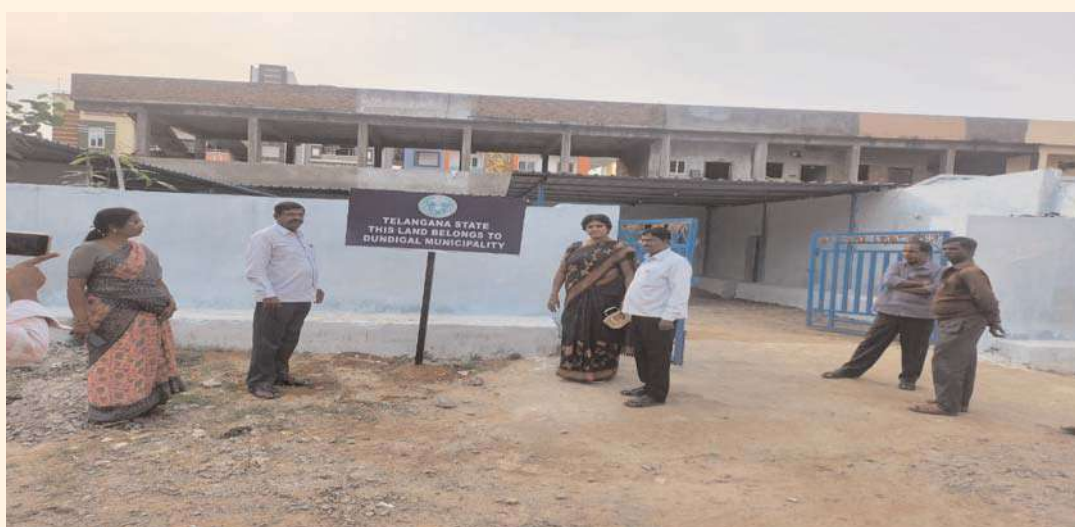
మేడ్చల్ అక్టోబర్ 24 అక్షిణ బ్యూరో :

అనే శీర్షికతో అక్షిణ జాతీయ దినపత్రికలో ప్రచురితమైంది.. ఎట్టకేలకు స్పందించిన మున్సిపల్ అధికారులు.. దుండిగల్ కల్లు కాంపౌండ్ వద్ద దుండిగల్ మున్సిపల్ స్థలం బోర్డు ఏర్పాటు చేసిన అధికారులు.. మున్సిపల్ ఆక్ట్ అమలు చేస్తామని స్పష్టం చేసిన కమిషనర్ కల్లుకుంట్ల సత్యనారాయణ రావు..