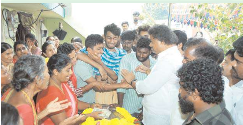
మిర్యాలగూడ, అక్షిత ప్రతినిధి :