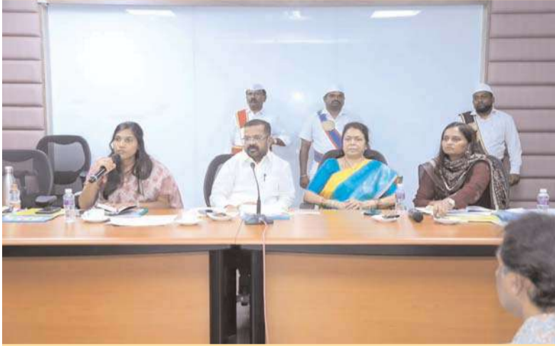
వరంగల్, అక్షత బ్యూరో: