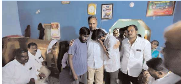
చేర్యాల అక్టోబర్ 29 అక్షయ ప్రతినది: