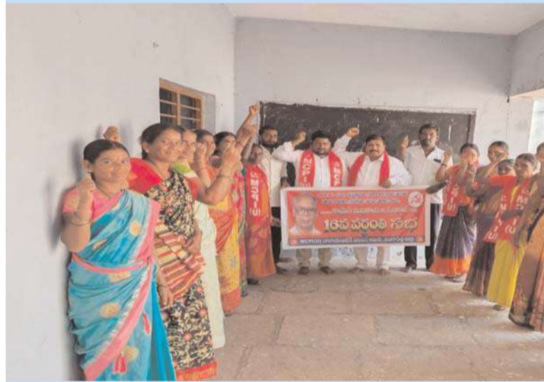
సంగా రెడ్డి అక్షయ ప్రతినది..