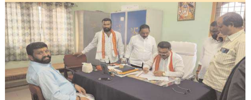
కొమురవెల్లి అక్షయ స్యూస్: