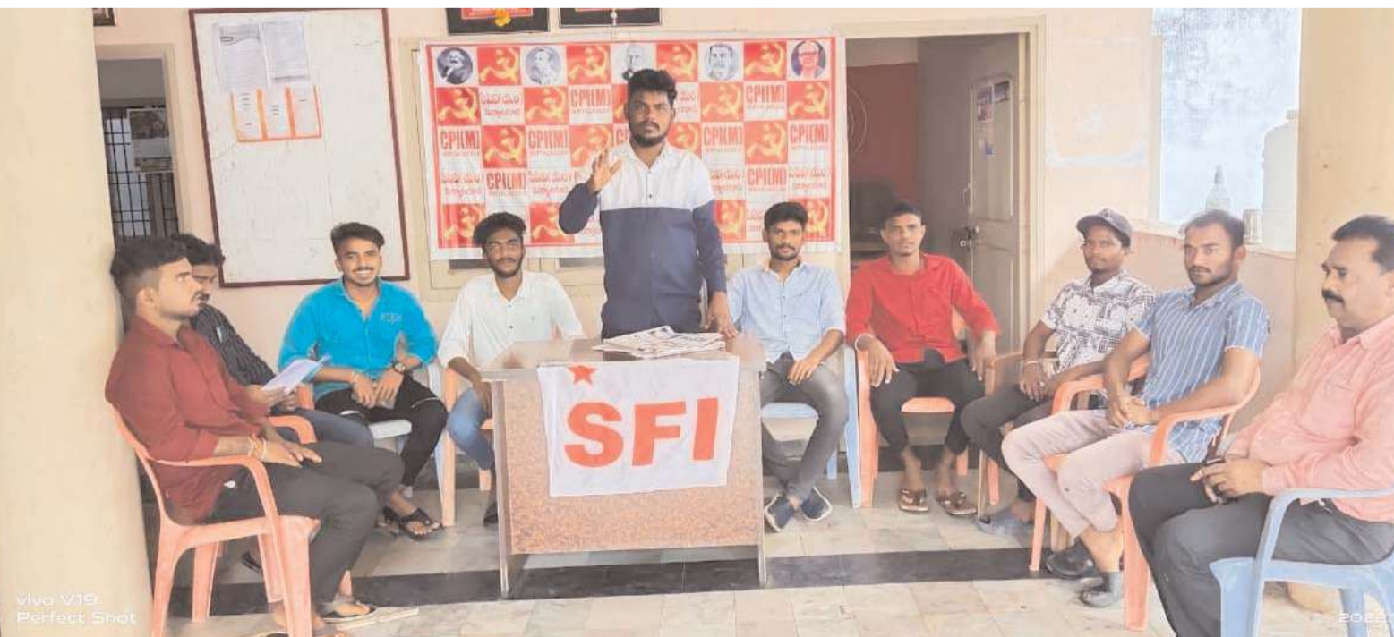
vivo V19 Perfect Shot