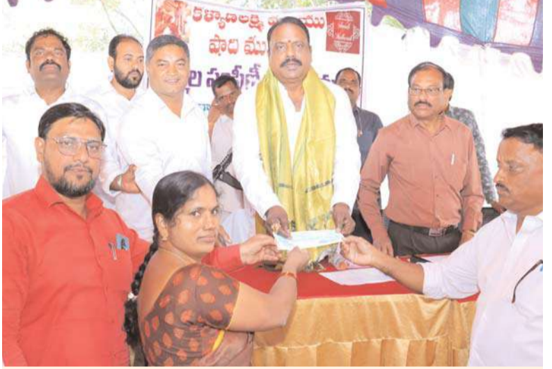
రాజేంద్రనగర్ అక్షిత ప్రతినిధి :