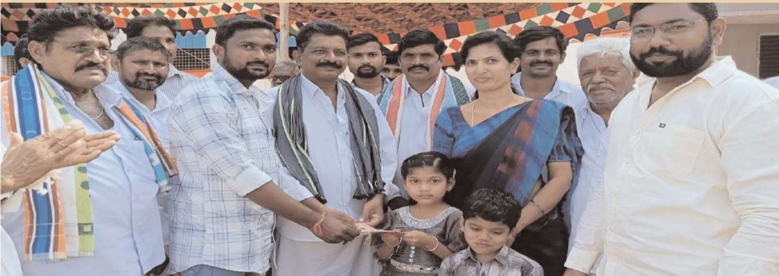
NARZO 70 5G 27mm f/1.8 1/231s ISO50