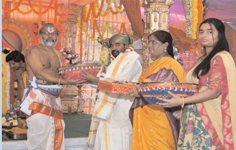
సూర్యాపేట, అక్షత ప్రతినీధి: