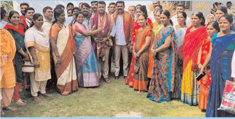
మేడ్చల్, అక్షయ బ్యూరో :