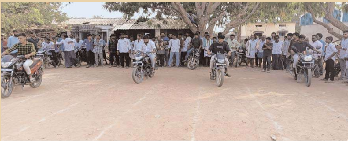
NARZO 70 5G 27mm f/1.8 1/175s ISO50