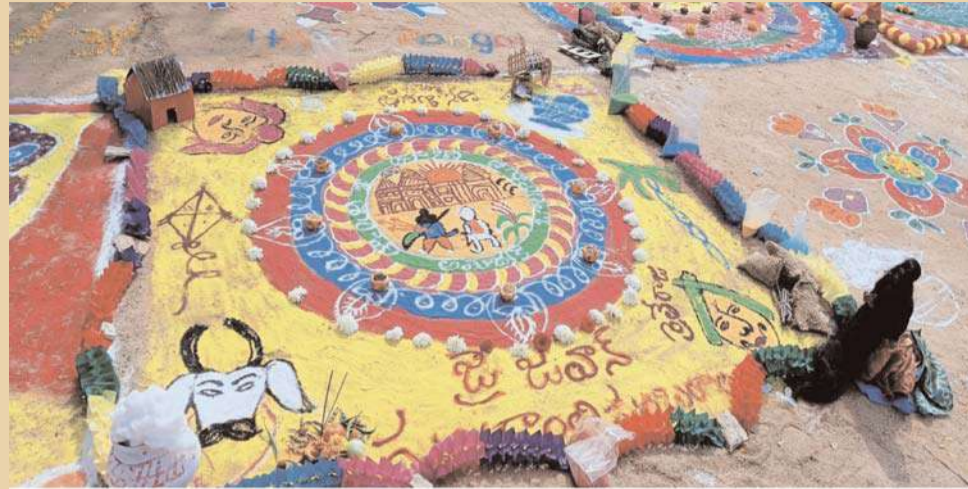
NARZO 70 5G 27mm f/1.8 1/702s ISO64

ప్రారంభోత్సవంలో పాల్గొన్న చింతలపాలెం ఎస్సై నర్రా అంతిరెడ్డి