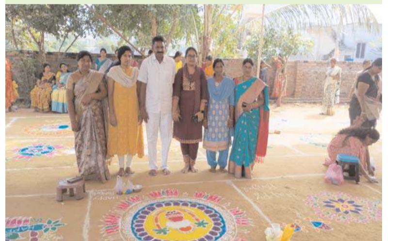
మిర్యాలగూడ, అక్షత ప్రతినిధి :