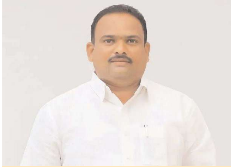
రామన్నపేట అక్షయ ప్రతినిధి