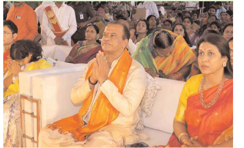
నల్గొండ, అక్షత ప్రతినిధి :