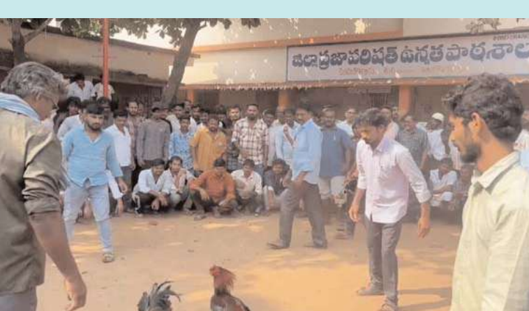
కాకినాడ, అక్షిత ప్రతినది :

ప్రభుత్వ విద్యాలయాల ఆవరణలో సంక్రాంతి పండుగ సందర్భంగా కోడిపందాలు, పేకాట, గుండ్రం నిర్వహిస్తున్నారు. కాకినాడ జిల్లా తుని రూరల్ ప్రాంతమైన వెలమ కొత్తూరు గ్రామంలో ప్రభుత్వ పాఠశాలలో ఉంది. సంక్రాంతికి ముందు జూదం వద్దు.. సంప్రదాయ క్రీడలు ముద్దు అనే నినాదంతో పోలీసులు క్రీడా పోటీలు నిర్వహించారు. అదే ఆవరణలో మళ్లీ కోడిపందాలు నిర్వహించడంపై సర్కార్ విమర్శలు వినిపిస్తున్నాయి. ఈ వ్యవహారము అంతా తుని రూరల్ పోలీస్ స్టేషన్ కు అతి సమీపంలో జరుగుతున్నప్పటికీ పోలీసులు అటువైపు కన్నీరు చూడకపోవడంపై పలు అనుమానాలు వ్యక్తం అవుతున్నాయి. మంగళవారం ఉప్పరగూడెంలో కోడిపందాల్లో ఇరు వర్గాల మధ్య మాట మాట పెరిగి ఘర్షణకు కొట్లాటకు దారి తీయడంతో పోలీసుల లాఠీ చార్జి చేసి వారిని చెదరగొట్టారు. ఆ గ్రామంలో రాత్రంతా పోలీస్ ఫిర్దీంగ్ ఏర్పాటు చేశారు. తుని పట్టణంలో పలు ప్రాంతాల్లోనూ పలు గ్రామాల్లోనూ కోడిపందాలు నిర్వహించారు.