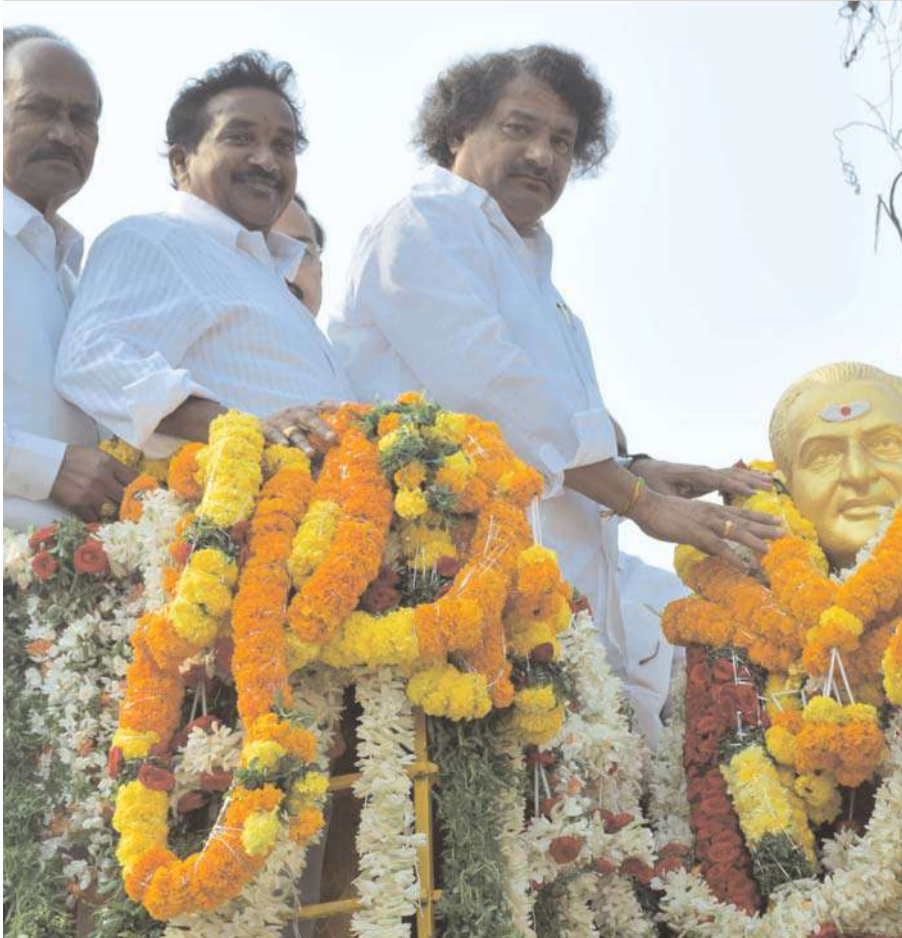
మిర్యాలగూడ, అక్షిత ప్రతినిధి :