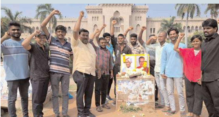
ఉస్మానియా యూనివర్సిటీ, అక్షయ ప్రతినిధి :