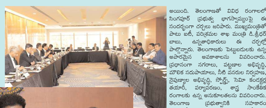
అయింది. తెలంగాణలో వివిధ రంగాలలో సింగపూర్ ప్రభుత్వ భాగస్వామ్యంపై ఈ సందర్భంగా చర్చలు జరిపారు. ముఖ్యమంత్రితో పాటు బీజే, పరిశ్రమల శాఖ మంత్రి డి.శ్రీధర్ బాబు, ఉన్నతాధికారులు ఈ చర్చల్లో పాల్గొన్నారు. తెలంగాణకు పెట్టుబడులకు ఉన్న అపారమైన అవకాశాలను వివరించారు. ప్రధానంగా నగరాలు, పట్టణాల అభివృద్ధి, మౌలిక సదుపాయాలు, నీటి వనరుల నిర్వహణ, నైపుణ్యాల అభివృద్ధి, స్పెషల్, సెమా కండక్టర్ తయారీ, పర్యావరణం, శాస్త్ర సాంకేతిక రంగాలకు ఉన్న అనుకూలతలను వివరించారు. తెలంగాణ ప్రభుత్వానికి సహకారం అందించేందుకు సింగపూర్ మంత్రి గ్రేస్ పు హైయన్ సానుకూలంగా స్పందించారు. తెలంగాణ రైజింగ్ లక్ష్య సాధనలో భాగంగా రాష్ట్ర ప్రభుత్వంతో భాగస్వామ్యం పంచుకోవాలనే రాష్ట్ర ప్రభుత్వ ఆహ్వానాన్ని పరిశీలిస్తామని హామీ ఇచ్చారు. ప్రధానంగా పూర్వ సీటీ, మూసీ వునరుజ్జవన ప్రాజెక్ట్, నీటి వనరుల నిర్వహణ, తెలంగాణ ఎంచుకున్న సుస్థిర వృద్ధి ప్రణాళికలపై ఎక్కువ ఆసక్తి ప్రదర్శించారు. పలు ప్రాజెక్టుల్లో పరస్పరం కలిసి పని చేసేందుకు అంగీకరించారు. ఉమ్మడిగా చేపట్టాల్సిన ప్రాజెక్టులు, వాటిపై అధ్యయనం చేసేందుకు ప్రత్యేక బృందాలను గుర్తించాలని నిర్ణయించారు. వివిధ రంగాల్లో సింగపూర్ అనుభవాలను పంచుకోవాలని, దేశంలోనే వేగంగా వృద్ధి చెందుతున్న తెలంగాణలో సంయుక్తంగా చేపట్టే ప్రాజెక్టుల కార్యాచరణ వేగవంతం చేయాలని నిర్ణయించారు.

సింగపూర్ లో పర్యటిస్తున్న ముఖ్యమంత్రి రేవంత్ రెడ్డి నేతృత్వంలో తెలంగాణ రైజింగ్ ప్రతినది బృందం సింగపూర్ వాణిజ్య, పర్యావరణ మంత్రి గ్రేస్ పు హైయన్ తో భేటీ