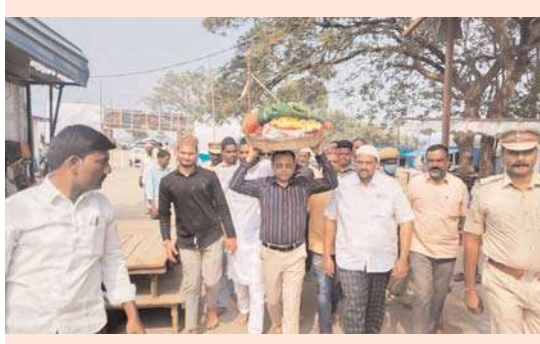
పరంగల్, అక్షయ జ్యూరీ: