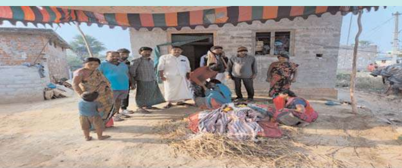
NOTE 40 Pro 23mm f/1.75 1/100 ISO118