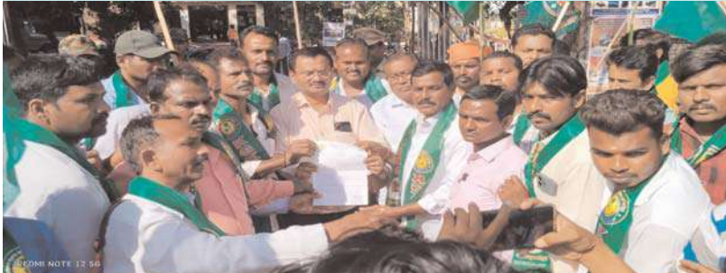
ములుగు అక్షయ బ్యారో,