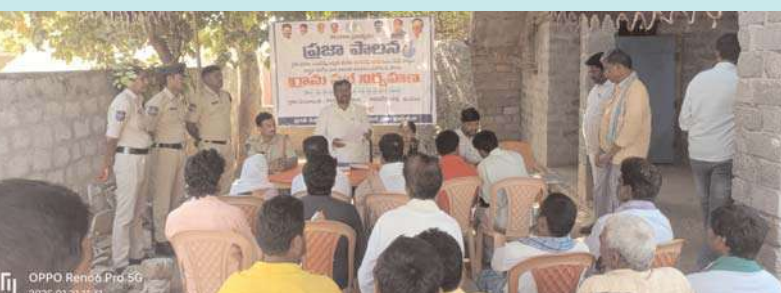
అడవిపేటలపల్లి అక్షిత ప్రతినిధి:-