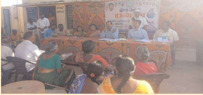
కోసం వచ్చిన దరఖాస్తులను సమగ్ర పరిశీలన జరిపి, ప్రభుత్వ నిబంధనలకు అనుగుణంగా లబ్ధిదారుల ముసాయిదా జాబితా