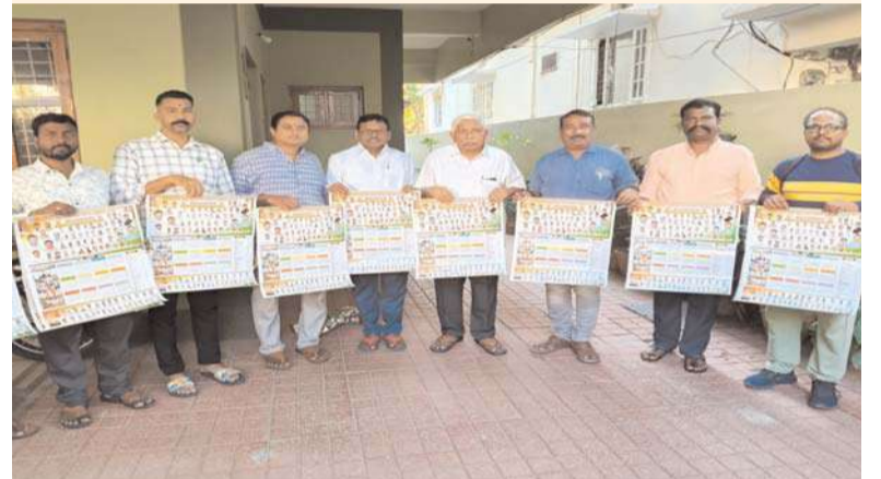
శేరిలింగంపల్లి అక్షయ ప్రతినిధి..మంగళవారం