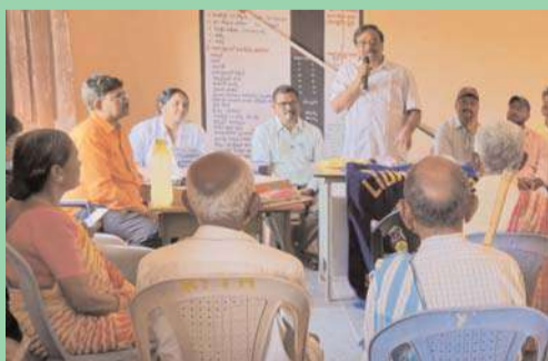
శాలిగౌరారం మార్చి 13 అక్షిత న్యూస్ :

లయన్స్ క్లబ్ సేవలను ప్రజలు సద్వినియోగం చేసుకోవాలి