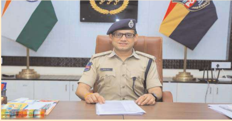
చేయాలని పోలీస్ అధికారులకు ఆదేశించారు.

హెహాలీ సందర్భంగా ఖమ్మం పోలీస్ కమిషనరేట్ పరిధిలో సిటి పోలీస్ యాక్ట్ ఆంక్షలు అమలులో వుంటాయని పోలీస్ కమిషనర్ సునీల్ దత్ గురువారం ఓ ప్రకటనలో తెలిపారు. హెహాలీ పండుగ వేడుకలను ప్రశాంత వాతావరణంలో జరుపుకోవాలని రోడ్లపై ట్రాఫిక్ అంతరాయం కలిగించిన వాహనాలపై గుంపులు గుంపులుగా తిరుగుతూ పరిచయం లేని వ్యక్తులపై రంగులు జల్లడం వాహనాలపై వెళ్ళేవారిపైనా వారి అనుమతి లేకుండా బలవంతంగా రంగులు చల్లిన గొడవలు సృష్టించిన కఠిన చర్యలు తప్పవని అన్నారు. ఎవరైనా నిబంధనలు అతిక్రమిస్తే చర్యలు తీసుకుంటామని చెప్పారు. శాంతి భద్రతలకు ఎలాంటి విఘాతం కలగకుండా ముందస్తు చర్యలలో భాగంగా మార్చి 14 న ఉదయం 6 గంటల నుండి సాయంత్రం 6 గంటల వరకు అంక్షలు అమలులో వుంటాయని తెలిపారు. అదేవిధంగా హెహాలీ రోజున ప్రధాన కూడళ్ళతో పాటు సాగర్ కెనాల్ మున్నేరు రిజర్వాయర్ల వద్ద పోలీస్ బందోబస్తు పెట్రోలింగ్ ముమ్మరం చేయాలని పోలీస్ అధికారులకు ఆదేశించారు.