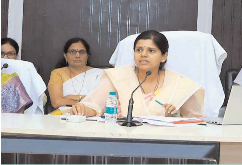
నల్గొండ, అక్షత ప్రతినిధి :

శిశు మరణాలు లేని జిల్లాగా నల్గొండను తీర్చిదిద్దాలని జిల్లా కలెక్టర్ కోరారు. గురువారం ఆమె ఉదయాదిత్య భవన్లో మిర్యాలగూడ డివిజన్ పరిధిలో శిశు మరణాలపై నిర్వహించిన సమీక్ష సమావేశంలో మాట్లాడుతూ ప్రసవానంతరం వివిధ కారణాలవల్ల శిశువులు చనిపోవడాన్ని తగ్గించాలని, ఇందుకు వైద్య ఆరోగ్యశాఖతోపాటు, మహిళా, శిశు సంక్షేమ శాఖల అధికారులు కృషి చేయాలని అన్నారు. అవగాహనలోపం, మూఢనమ్మకాలు, సకాలంలో వైద్యం అందకపోవడం తదితర కారణాలవల్ల శిశువులు చనిపోవడానికి వీలులేదని, సాధ్యమైనంతవరకు వారిని బ్రతికించేందుకు ఆశలు, ఏఎన్ఎం లతో సహా, డాక్టర్లు కృషి చేయాలని అన్నారు. ముఖ్యంగా గ్రామస్థాయిలో మహిళ గర్భం దాల్చినప్పటి నుండి వారి ఆరోగ్యంతో పాటు, పుట్టబోయే శిశువు ఆరోగ్యం పట్ల పుట్టిన తర్వాత తీసుకోవాల్సిన జాగ్రత్తలపై తెలియజేయాలని, పుట్టిన వెంటనే తల్లిపాలు పట్టించడం, పాలు ఎలా పట్టించాలో, ఆ