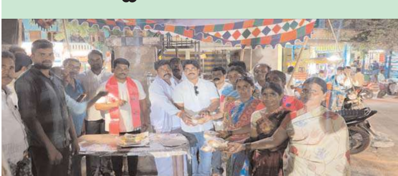
చింతలపాలెం అక్షిత ప్రతినిధి