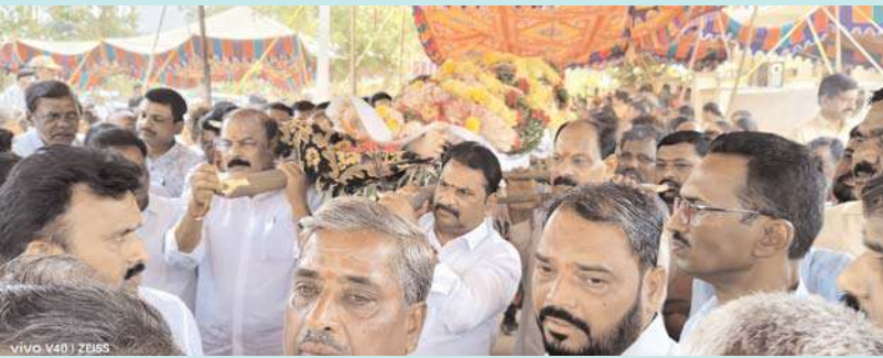
చేర్యాల, అక్షిత ప్రతినిధి: